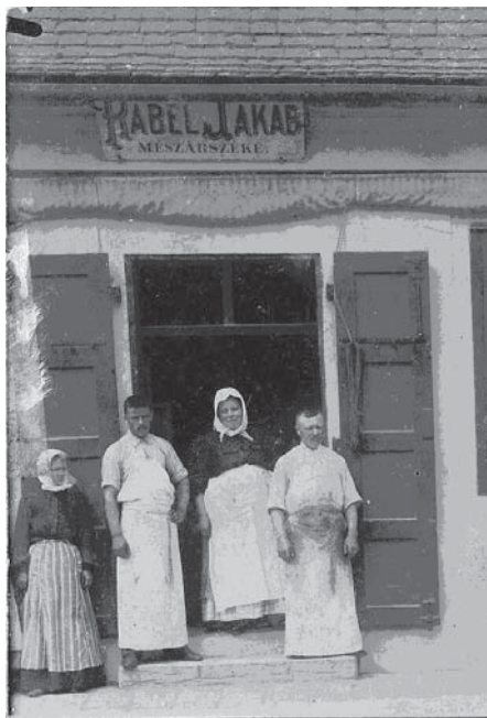
A Flórián téri üzlet bejárata