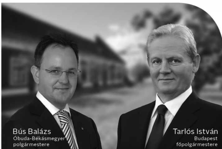
Bús Balázs Óbuda-Békásmegyer polgármestere