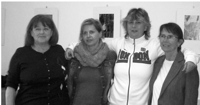
Hazai második helyezett csapat

Legutóbb beszámoltam a Nagykanizsai kiruccanásunkról, amely annyira jól sikerült, hogy ott helyben felvetettük, hogy mi is szervezhetnénk egy hasonló versenyt. Ezt az elhatározást tett követte. Október 16-17-ei hétvégén megtartottuk a Csapatversenyt. A győztes egy vándorkupát kap, amelynek birtoklásáért mostantól kezdve minden évben újra lehet küzdeni. A versenyen a hazai klub 4 csapatán kívül, Nagykanizsa két együttese, Dunaújváros, Jászberény és Tatabánya csapatai indultak. A megjelentek nagyon elégedetten távoztak. Külön öröm, hogy olyanok is jelentkeztek, akik eddig még nem próbálták ezt a versenyformát. A győztesek: Nagykanizsa 1-es számú csapata, majd a Budai Motorosok (a mi klubunk) két csapata holtversenyben. A vándorkupán kívül az első, második és harmadik helyezettek kisebb kupát is hazavihettek.