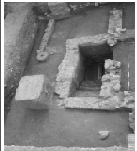
A római pince a 2010. évi feltárás idején

Láng Orsolya ásatásvezető régész tanulmánya nyomán