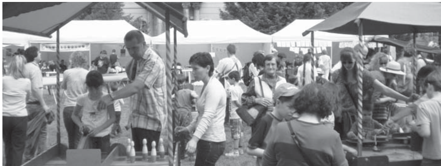
Kerületi civil szervezetek találkoztak a Zichy-kastély udvarában május 2-án, az Óbuda Napján.