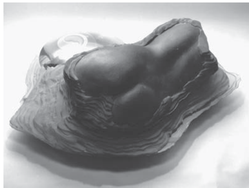
Lugossy Mária: Földanya (1994)

- Mária szobrain érezni az anyaság örömét és méltóságát, csodálatos, ahogy ezeket a mély gondolatokat, érzéseket szobrokba gondolva meg tudja fogalmazni.