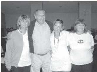
Budai Motorosok I. csapata

A hónap elején két csapatunk, a „Budai Motoros I” és a „Budai Motoros II” elfogadta a Nagykanizsai Bridzs SE hagyományteremtő szándékkal, 4 csapat részvételével rendezett bridszversenyre való meghívását.