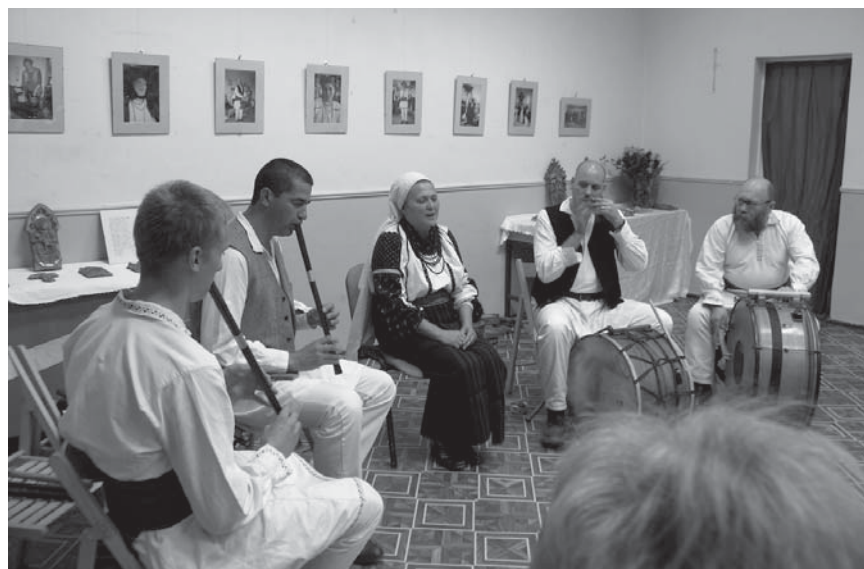
Mária énekel, tilinkószó, doromb és dob kíséri