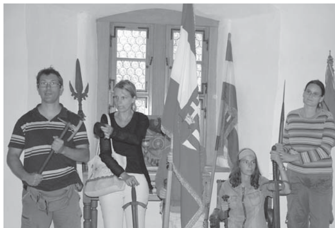
Borsi várában a Rákóczi-családot mintáztuk meg

A Latorca, majd a Laborc folyó után értük el a Bodrog folyót, s Felsőberecki volt az első magyarországi szálláshelyünk. Itt egy hajnalig tartó táncmulatságot szerveztünk. Innen mentünk el néhányan kora reggel Karosra, a híres Árpád-kori temetőnkhez, történelmi emlékhelyhez, ahol fejet hajtottunk a fejedelmi sírnál, miközben a távol-