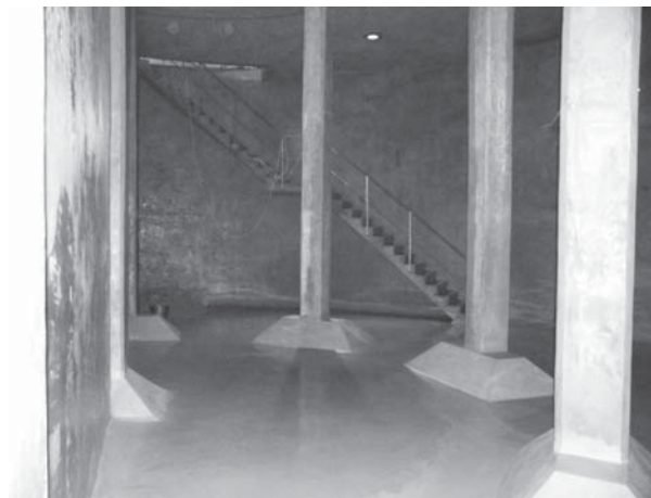
A közel 6 méter magas, felújított víztér.