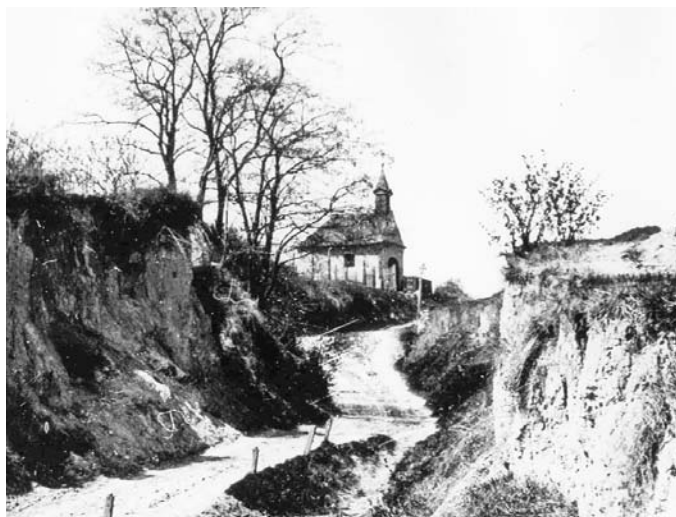
A „Nagy út”, azaz a Farkastorki út az 1900-as éve elején

Akkor még nem voltak utcanevek, és a házaknak csak helyrajzi számai voltak. A mai Laborc utca poros földút volt, egészen le a Bécsi útig. Ezt a poros, keskeny szekérutat neveztük mi őslakó hegyiek „Kisút”-nak, a hegy felőli oldalon a régi temetővel, amelytől egy vízelvezető árok választotta el. A temető galagonya, kökény és csipkebokrok szegélyezték. A Bécsi út felőli oldala, felváltva hol kukorica-, hol árpaföld volt. Később megvette vagy csak bérelte egy virágkertész, és az egész oldalt rózsacsemetékkal telepítette be. A temető felső oldalán húzódó mostani Farkastorki utat, amely kissé szélesebb volt, de nem kényelmesebb, hívtuk „Nagyút”-nak. A Bécsi útról felfelé kaptatva, a mostani Farkastorki út jobboldalán terült el a temető, akáccsokkal szegélyezve majdnem a szent Donát kápolnáig. Gondolataim csapongnak, de visszatérek újra a bölcsőhöz, a régi „Kisút”, azaz a mai Laborc utcához, amely öcsémnek