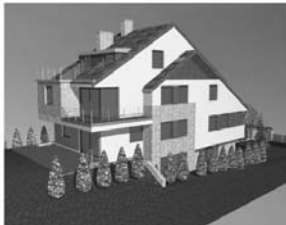
III. Erdőalja úton, 5 lakásos társasházban lakások leköthetőek! 06 70 456 0030