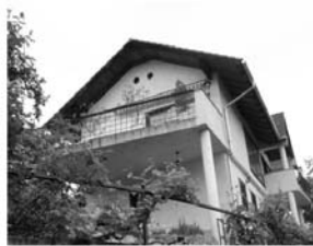
Táborhegy csendes utcájában panorámás 1500nm-es telken bővíthető, 240nm családi ház 89M 06 70 456 1030