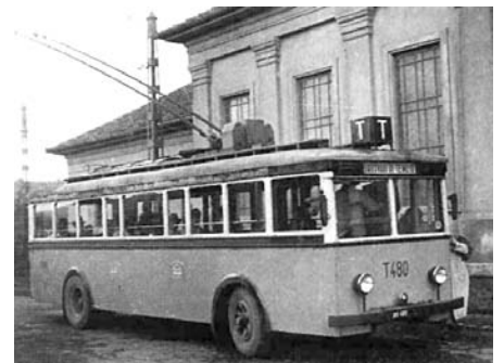
Trolibuszvégállomás, az Óbudai Temetőnél.

1949 májusától a Városligetben, a 70-es vonal megnyitása előtt, az óbudai trolikkal kezdték meg a járművezetők felkészítését, és továbbra is mint tanulókocsik működtek. A megnövekvő utasforgalom miatt 1953. augusztus 31-én a három troli egy darabig újra személyszállító állományba került. Ekkor valószínűleg bordóra festették át őket. A kocsik