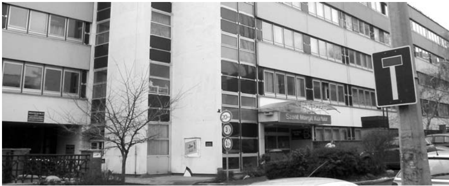
Zsákkutca? A további ágyókkentés valóban oda viszi a kórházat.

A Kórház vezetésének értékelése szerint az ilyen mértékű redukció már veszélyezteti a betegellátást, főként a belgyógyászati osztályokon, hiszen a kórháznak a kerületi lakosokon kívül kiemelt regionális feladatokat is el kell látnia, azaz még kb. 410 ezer ember részére kell fekvőbeteg ellátási háttérrel biztosítania. Féltő, hogy a kerületi betegek 30 százalékát nem tudják majd fogadni, holott az itt kezelték kb. 90 százaléka helyi lakos.