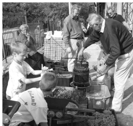
220 kg szőlőből 160 liter must lett. A 40 liternyi maradékot jövőre megkóstoljuk bor formájában – ha sikerül.

Az eddig leírtakból talán már látszik, hogy az Isten, a szem, az átváltozás, a forrás, a bor egy ugyanazon földi misztika szimbólumcsojra. Mert Isten egyenlő a mindent látó szemmel. Elég, ha csak a ke-