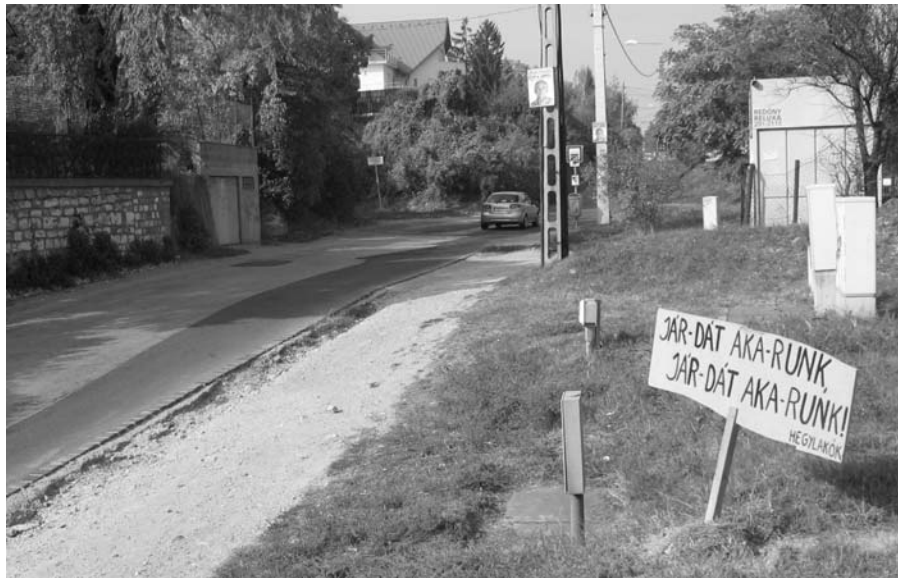
Ismeretlen tettes, ismert vágyat skandál a hegylakók nevében