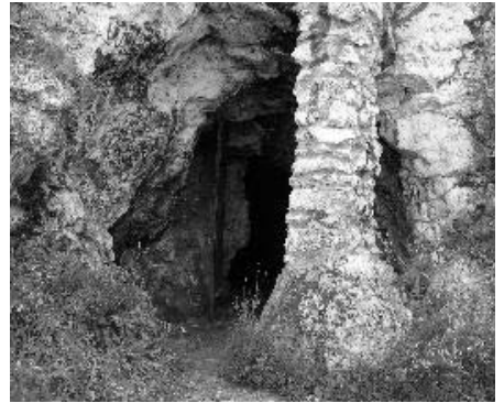
A 70 m hosszú Táborhegyi-barlang szája.

A történelem mást hozott. A „barlang körül dek-