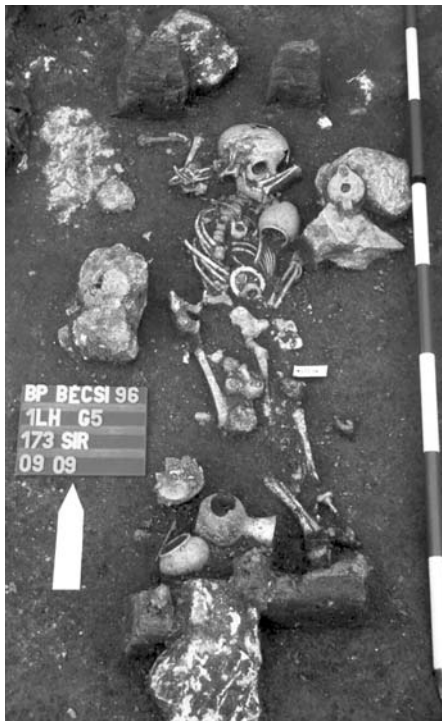
A gazdag kislányt a Kr. u. 4. században temették el.

Az elhunyt, akár a máglyára került, akár a frissen