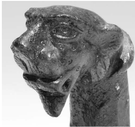
Párduc – a római kocsi egyik díszítményének részlete

ásott sírba, hitük szerint hosszú útra indult. Sírjába ételt-italt tartalmazó edényeket - legtöbbször korsókat, néha tálakat, tányérokat, palackokat és poharakat tettek. A leggyakoribb a helybeli műhelyek valamelyikében agyagból készült, nem túl jó minőségű edény, de a tehetősebbek és gyakran a gyermekek mellé drágább, más tartományokban gyártott darabokat – terra sigillatakat, üvegedényeket - adtak. Általánosan elterjedt kísérő tárgy volt az agyagból készült olajmécses s a túlvilági révésznek járó adó hagyományát őrző, a halott kezébe vagy bőrczacskóba helyezett pénzérme is. Gyakran sírba került a halott kedves tárgya, pl. bronzveretes ládikája, guzsalya is, s temetésekor ékszereit is magán viselte.