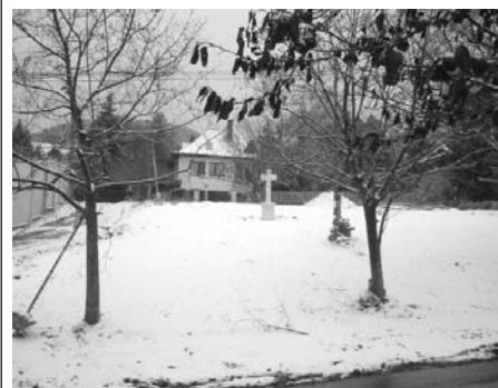
Az út felé megnyílt Jablonka park a hó alatt