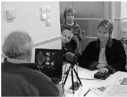
Aura-csakra fotó számítógépes elemzése

Ebben az évben Erzsébet napjára esett a hagyományörző, egészségvédő találkozásunk a Népházban. A lapunk legutóbbi, novemberi számában jelzett program szerint jöttek is a termékeiket ajánló cégek képviselői. Volt ott mindenféle földi jó. A biotermékektől, a táplálék kiegészítőktől, az energiatakarékos főzőedényekig, a kozmetikumokig, az állapotfelmérésig mindent megtalálhattunk. Na, és Raffi kitűnő süti-jei ... Idén bensőségebb volt a találkozó. Szinte már a szeretetről szólt. Lehetett érezni, nem a pénzügyi forgalom az elsődleges. Bármelyik asztalnál álltunk meg, a termékismertető arról szólt, mivel segítenének. Ha pedig konkrét gondunk van, milyen