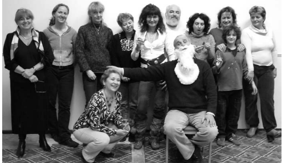
Akik a Mikulás ajándékait csomagolták

Az Egyesület elnöksége (Ünnepségünket az Önkormányzat anyagilag támogatja.)