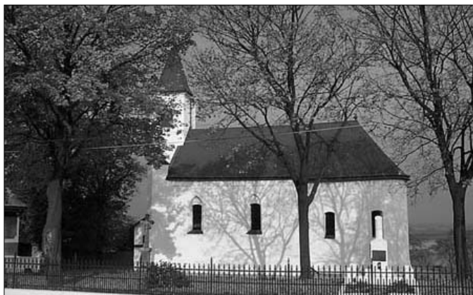
Perény temploma