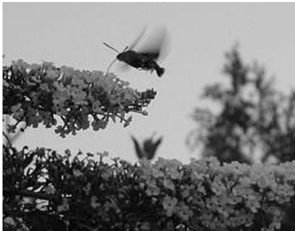
Kacsafarkú szender surranó, gyors röptű lepke lebegve szívogatja a nyári orgona nektárját.

Régebben, a nagyobb városok kertvárosi részein sövénynek ültetett gyöngyvessző (Spirea) fajokon gyakran meg lehetett figyelni egy sötétbarna, fehér sávozású, feltűnő lepkét: a nagy fehérsáv-lepkét. A lepke hernyója a gyöngyvessző cserjén él, a cserje összesodort, elszáradt levelei között teletel át, báb alakban. Ha valakinek sikerülne becsalogatni kertjébe ezt a lepkét, akkor nem csak a „madárbarát kert” elismerésre, hanem a „lepkébarát kertész” címre is méltán tarthatna igényt.