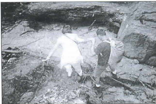
Túlélés közben – most hová is lépjek?

Fizikális állóképességünk rendben lévén már csupán egyetlen pszihés megpróbáltatás maradt számunkra ugyanis kikötő ide, kikötő oda nem állt meg a