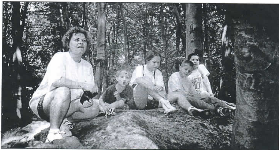
Zsiványjelöltek pihenője a Zsivány-sziklán