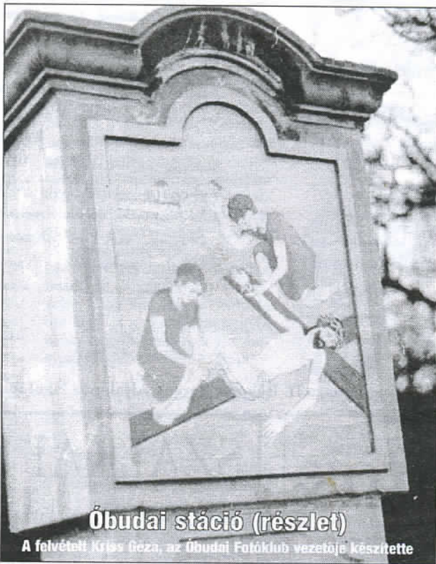
Óbudai stáció (részlet)

A szélfü harang alakú fejét még a föld irányába horgaszta, mintha megfigyelne utoljára valamit, mielőtt kinyílásra készen fölegyenesedne. Előbújt a lila virágú leánykőrcsin is, a Tábor-hegyi védett virága. A szárazon már a kifejtett virág, levelek, szirmok, egyedi létük örök formái. A tábor-hegyi árokba leereszkedve követjük az árok irányát. Elhullott szajkótollak fájdalmas küzdelemről hallgató avarpárnán. Vajon milyen tragikus élethalál-harc nyomain lépkedünk? Róka tépszét a madarat vagy bagoly áldozata lett? A las-