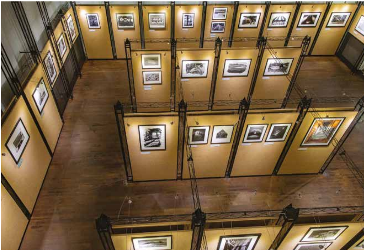
A Magyar Fotográfiai Múzeum kiállító tere.

Az első kiállítási fellépéseire 1986-tól került sor, hogy aztán napjainkig sűrűn, évente több alkalommal is újabb és újabb kollekciókkal mutatkozik be Komárom-Esztergom megye településein,