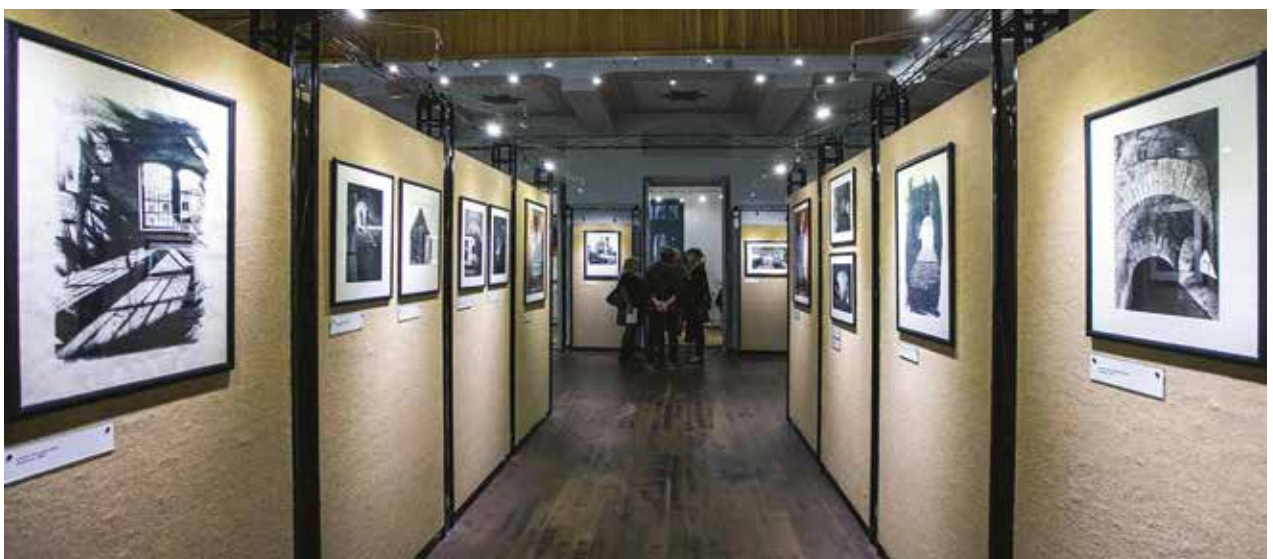
A Magyar Fotográfiai Múzeum kiállító tere.