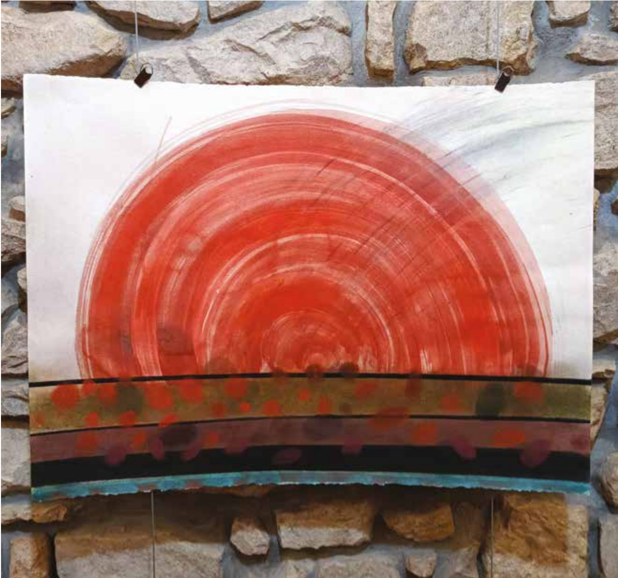
Új-Mexikó sorozat / merített papír, aquarell, 2007

szépségét. Műveiben a vadvirágok mellett egzotikus és titokzatos fajok jelentek meg. A közeli Lužánky park sokéves fáinak törzsével együtt „portrék”, szimbólumok és metaforák előfutáraivá váltak sok művében, melyeken az emberi életet kísérő fájdalmakat, sebeket és a megismerést jeleníti meg.