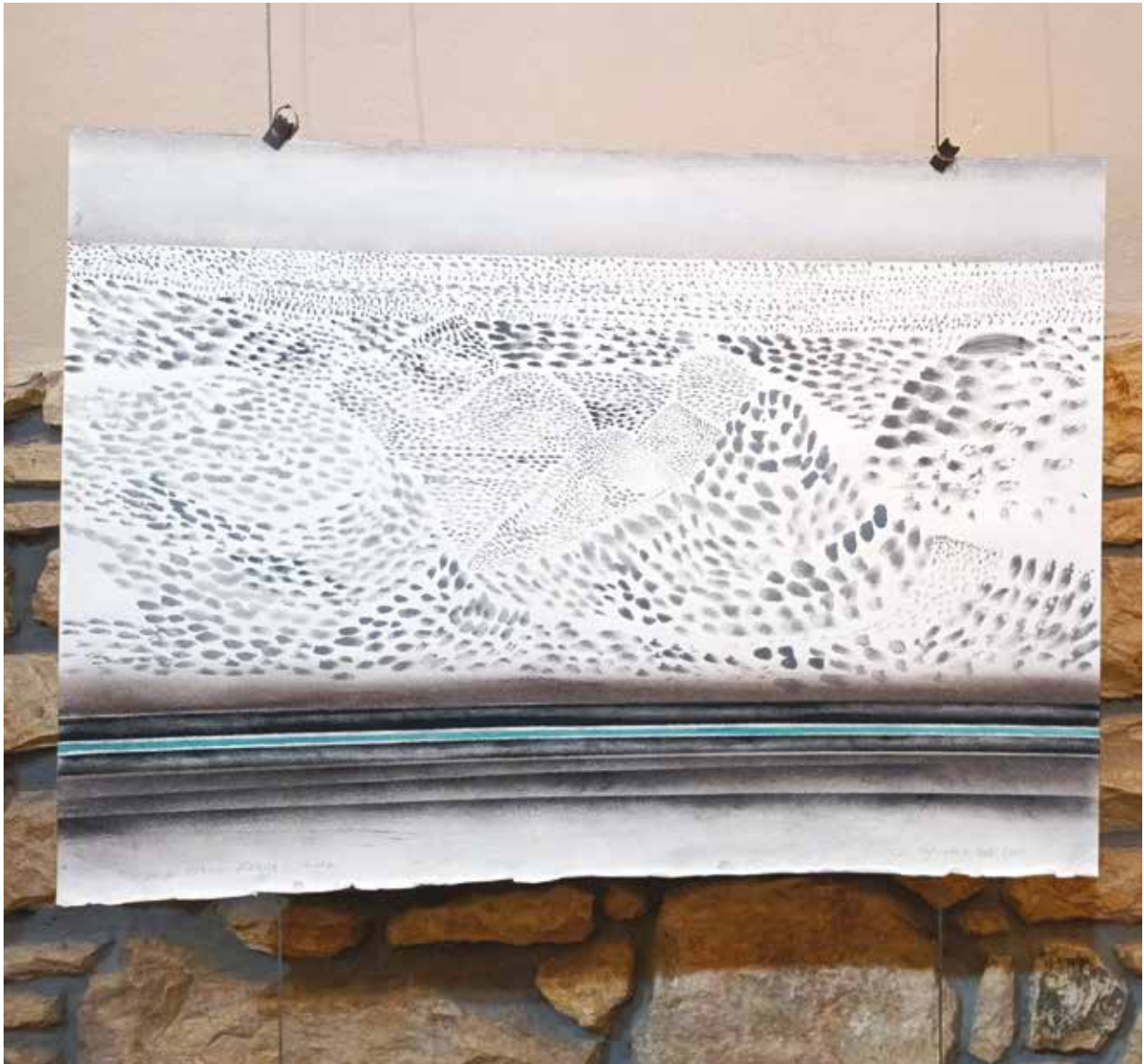
Új-Mexikó sorozat / merített papír, aquarell, 2007