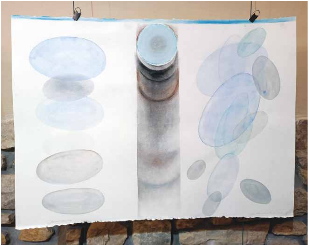
Új-Mexikó sorozat / merített papír, aquarell, 2007