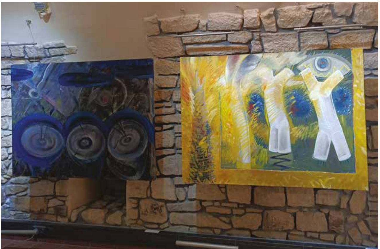
Kertem / olaj, vászon, 1996, Udvarom / olaj, vászon, 1997