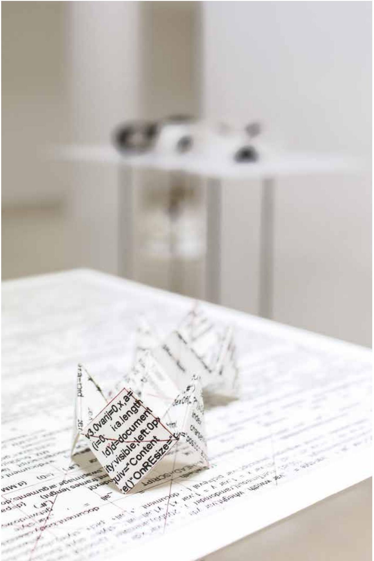
Korunk kommunikációs problémáit feszegeti a Csend válasz nélkül című ciklus.