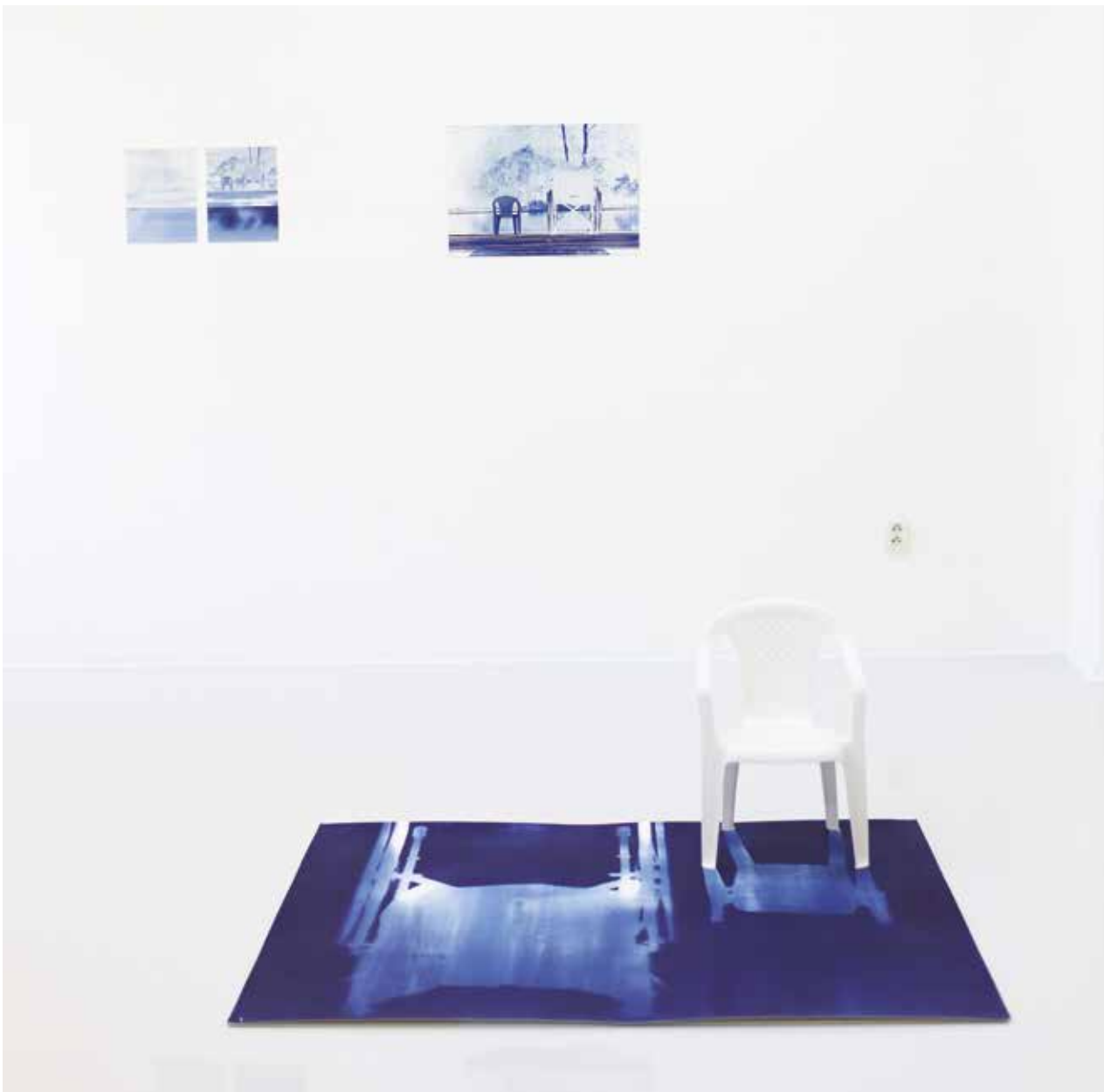
Reggelente... című új ciklus.

itt nem az illusztráció szerepét töltik be, a szöveges és képes résznek is, radikálisab kiképzése lehet. A művészkönyv, a könyv átalakulása önálló művészi objekttté, amely többnyire csak egy példányban létezik. A vaknyomással készült Kommunikáció című művészkönyv, rendkívül hatásos művészi elmélkedésnek tekinthető a kétfajta kommunikáció találkozásáról. Minden egyes oldalon, a betűvel együtt, egy braille-írással ábécére emlékeztető kép található. A tartalom itt nem fontos, egy haptikus-vizuális játékról van szó – absztrakt könyvről, a nemlátók számára. A Csend válasz nélkül című ciklusban is, a kommunikáció különböző formái vizualizálódnak. A fekete-fehér >html< sorozat központi témája, a html kód átírása és lefordítása, amely kifejezőmódját tekintve, a programozás nyelvét használja. Az hétköznapi felhasználó számára, ez a virtuális valóság és az internet láthatatlan és érthetetlen része egy