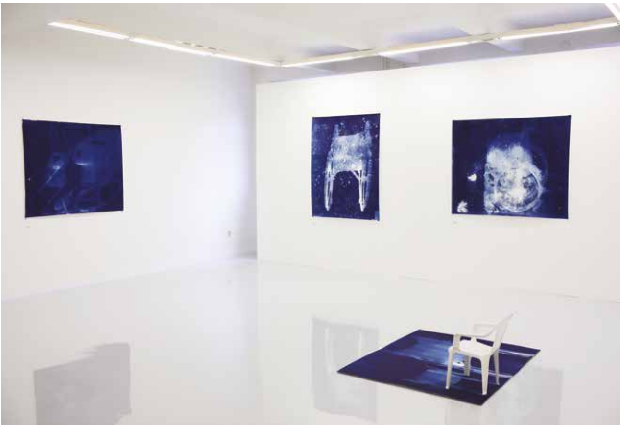
A kiállítás enteriőre az érsekújvári Zmeták Ernő Művészeti Galériában.