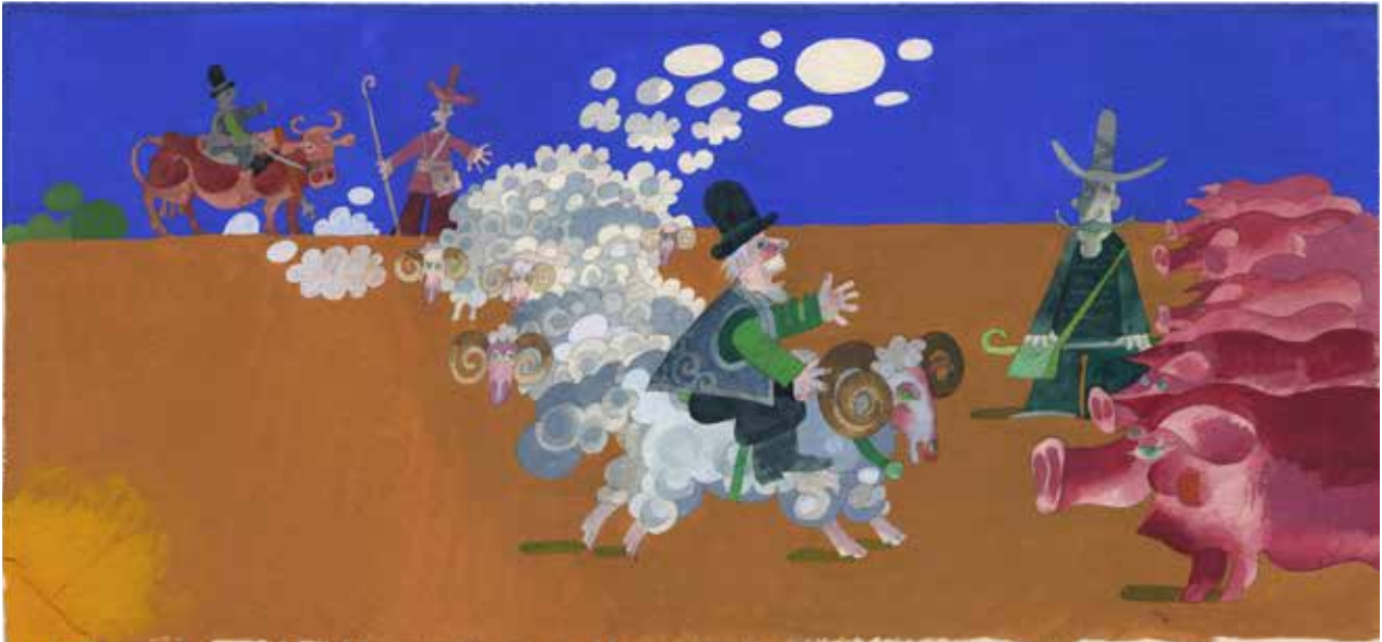
Boros Miklós János / Reggel, Délben, Este és Mosatlan címet viselő sorozatának részlete

meglehetősen bibliofil módon, kevés illusztrációval, az emberábrázolás és a környezet megjelenítésének kiegyensúlyozott szintézisével készült. A „Menekülés a Nyelvtantól” pedig úgy lett kialakítva, hogy párhuzamosan váltakoztatva mutassa be az ember és tárgyak, az ember és eszközei, illetve az ember és környezete konfrontációjának ábrázolásait.