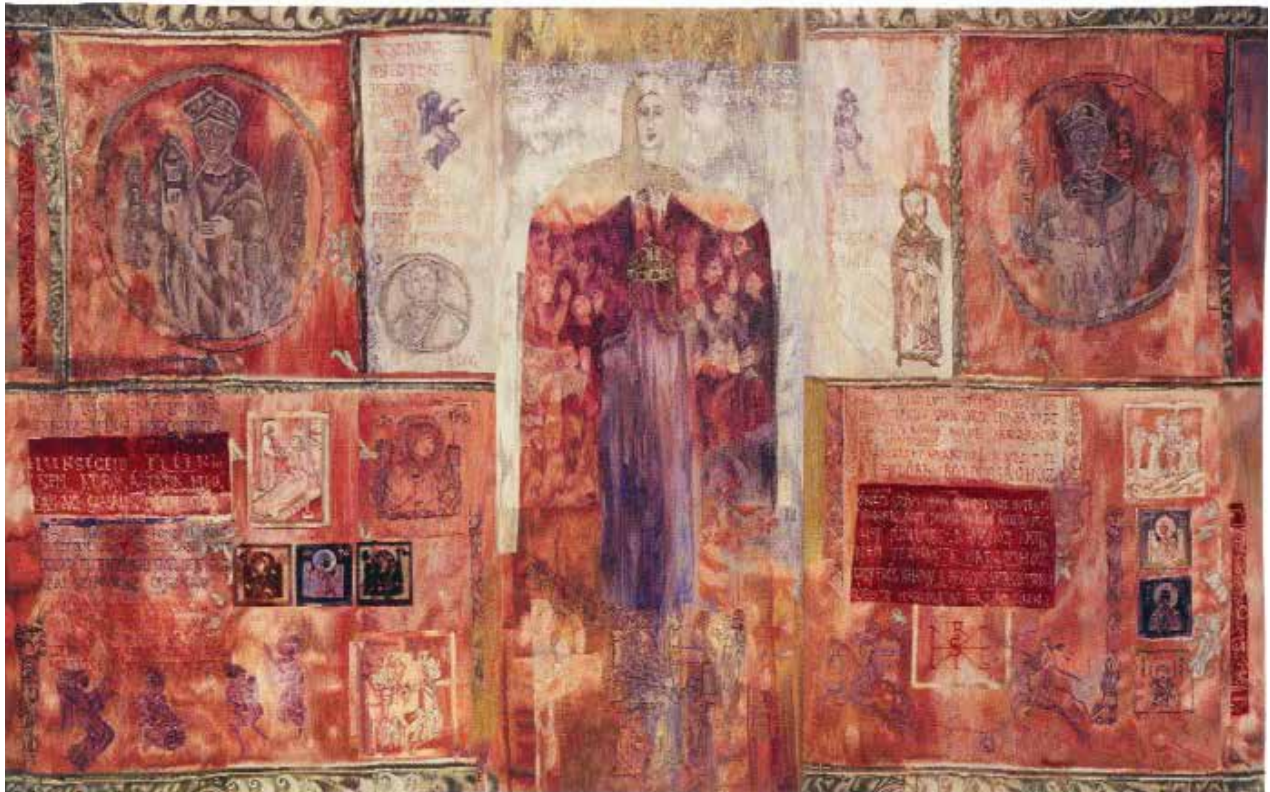
A megújult Szolnoki Művésztelep központi épülete.

– Nem. Dél-Komáromban laktak a mamám szülei,