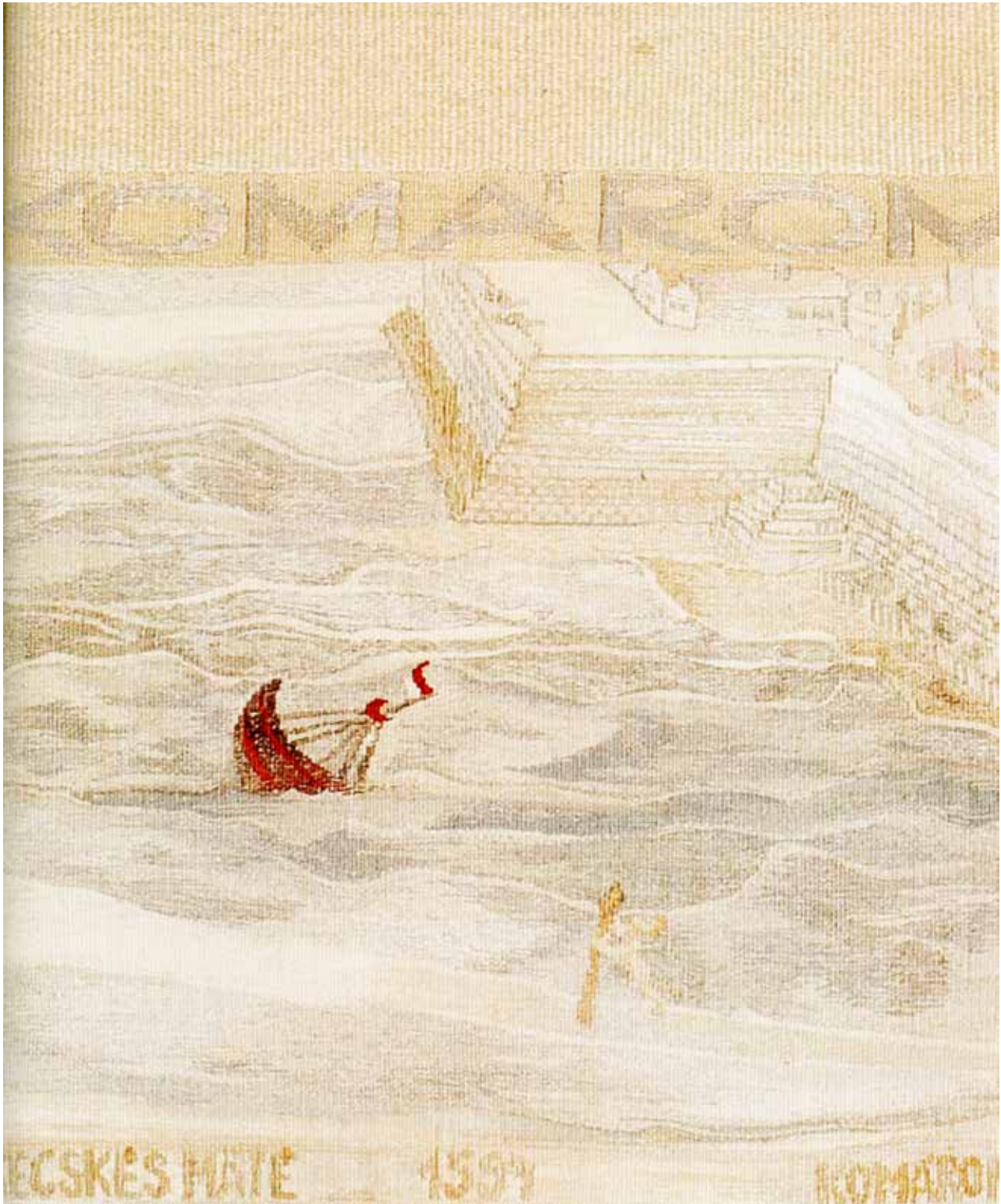
Az új szobrászműhely

hogy aztán megszöjtem róla. Ilyen feladatokat adott a diplomamunkára is. Az egyik baj az volt az én rajztanulásommal, hogy az szocreál, a másik baj, hogy naturalista. A rajztanítás, az arról szólt, hogy ül egy modell, és te figyeld meg. Milyen a szeme, az orra, hasonlítsd rá. Ha belegondolsz a középkori festészetbe, egyáltalán semmi szükség nem volt erre a fajta mesterségbeli tudásra. Iszonyú küzdelem volt ezt is levetkőzni, hogy ne legyen naturalista az az emberi figura. Sosem voltam hajlandó avantgárdot csinálni,