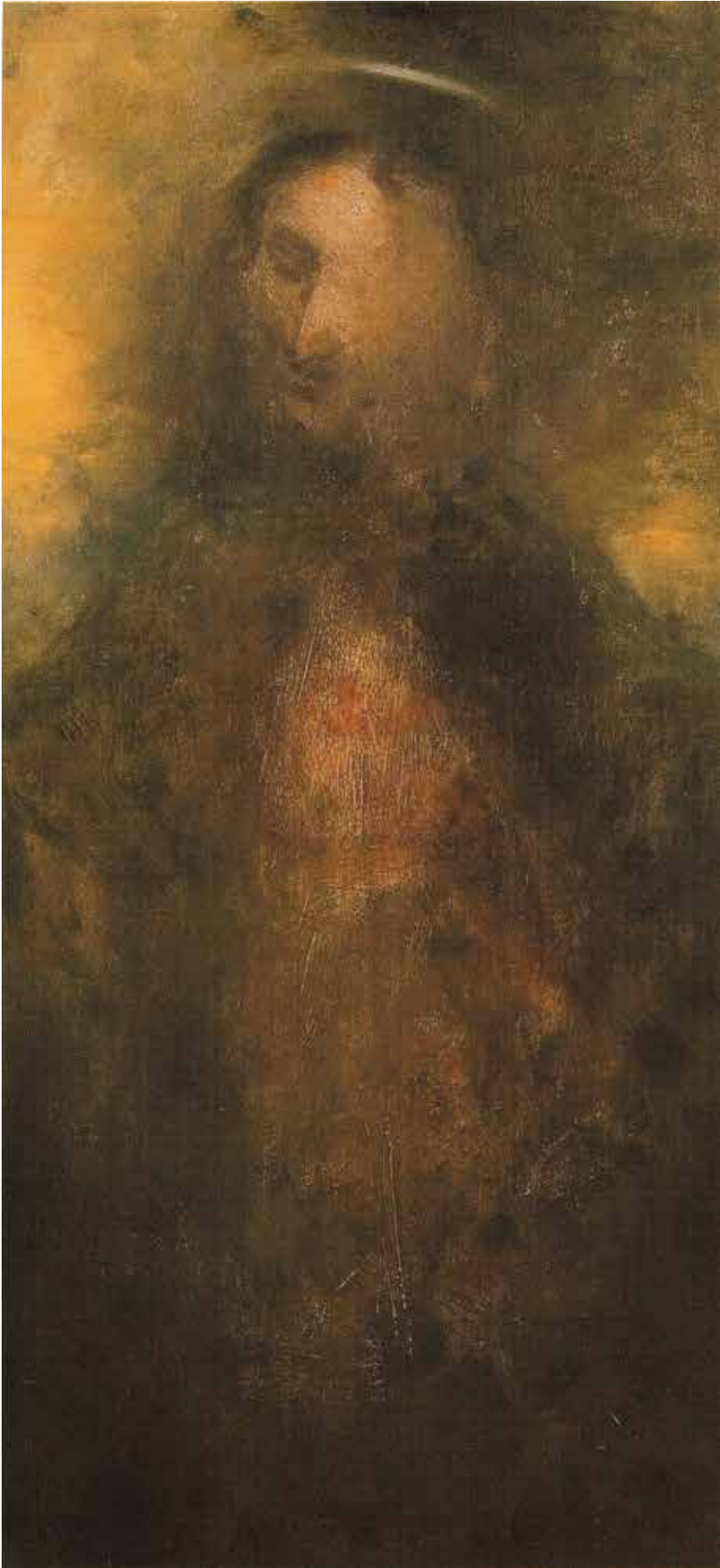
Este megint / olaj, papír, farost, 42x21 cm, 2008