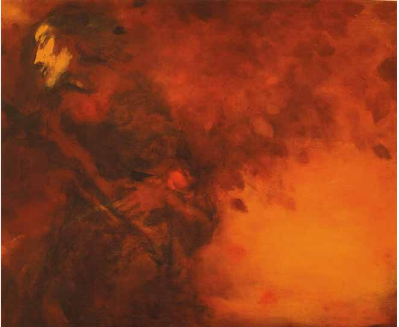
Sövény / olaj, fa, 50x60 cm, 2009

rendkívül lassú és megfontolt munkával készül, vagy inkább: elmélyült meditációk és tűnődések-érlelte képeinek megközelítése – leírási és értelmezési kísérlete – során számos fontos szempontot mérlegelhetnénk, és következtetéseinket a korábbi esztétikai és kritikai reflexiókkal összhangban, kiváló művészettörténészek, mások mellett Supka Magdolna és P. Szabó Ernő eszmefuttatásaival egyúttalhangzón vonhatnánk meg. A 2010-es évek festészeti és szobrászati műegyüttese szervesen kapcsolódik a művész korábbi alkotóperiódusainak nagyívű természetéhez, s ezáltal egy fontos, megkerülhetetlen, korjelző, a jelenkori magyar művészetben egyedülállósága révén is a legmagasabb széfrákba emelkedő festői oeuvre összefoglaló érvényű kollekciójának művei között szemlélődhetünk. A roppant következetes, nagyobb fordulatoktól mentes életmű kapcsán elemezhetnénk a klasszikus képalkotás hagyományának szívós továbbélését, az olajfesték mesterei, a legnagyobb mestereket idéző kezelését, a klasszikus kép-forma fenségének tiszteletben tartását. Megvizsgálhatnánk az e festészet lényegi vonásait megteremtő fantasztikus érzékenységű kolorizmus már-már totális voltát, s ennek egyik