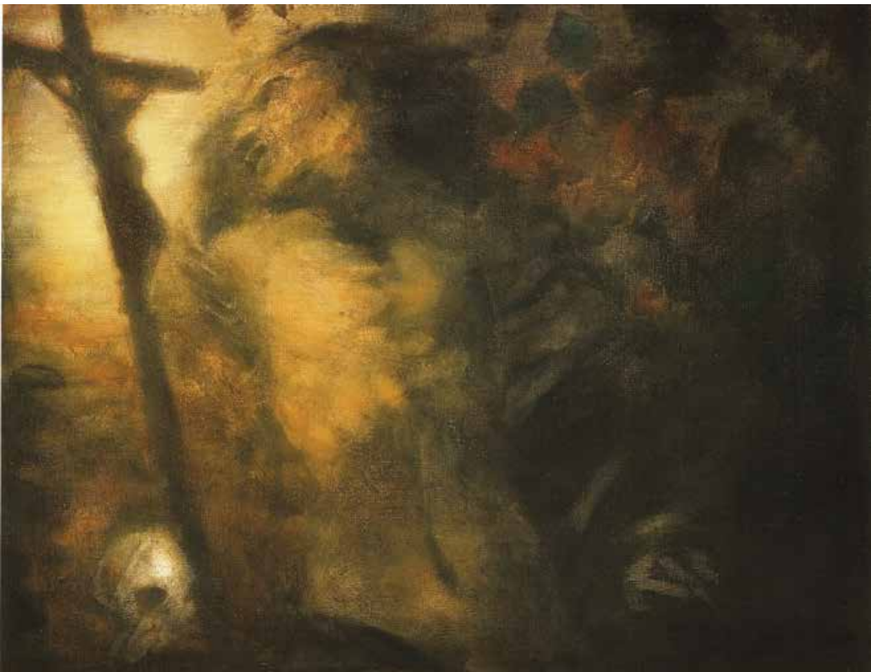
Hajnal / olaj, vászon, 40x50 cm, 2009

Mit kezdhet a felületek korszaka a mélységek művészetével?