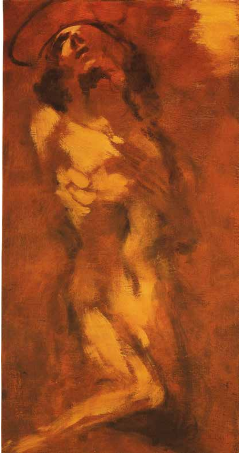
Láz / olaj, fa, 35x18 cm, 2009

Mit kezdhet a csillogó, villogó, gyors képváltások reklám-vizualitása a mozdulatlan, hosszú átélésre és elmélyült szemrevételezésre szánt képekkel?