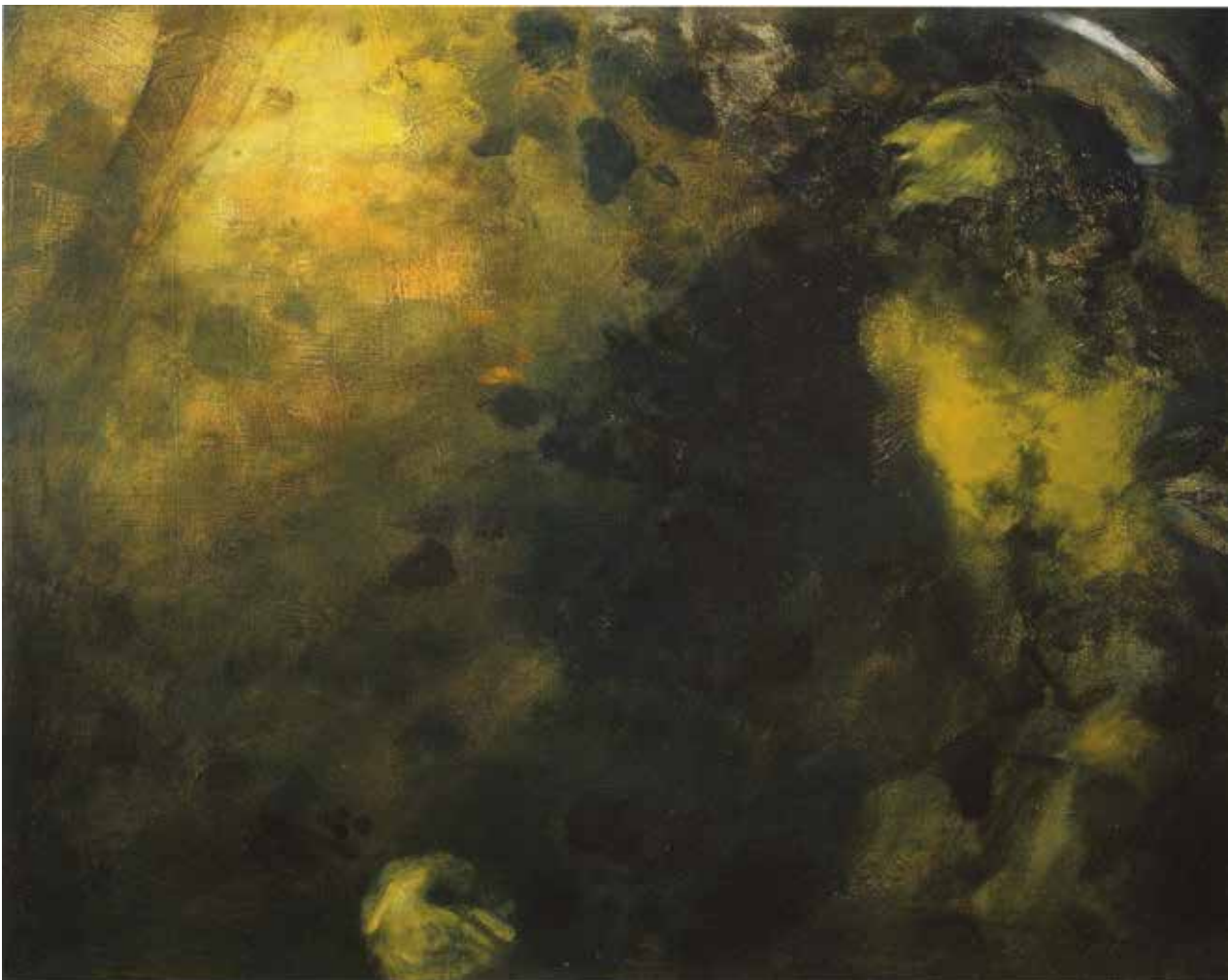
Styx / olaj, fa, 40x50 cm, 2009

A hagyományos művészettörténeti regisztráció szellemében leszögezhető: a XX. század utolsó harmadának és az új évezred első két évtizedének – a szocializmus és a rendszerváltás Magyarországnak – minden lényegi korjelensége, ellentmondása, súlyos értékvélsége ott motoz Kárpáti Tamás szakralitással determinált, alapvetően transzcendens lényegű, az emberi létezés alapkérdéseivel viaskodó, metaforikus piktúrájában. A múlt évszázad hetvenes éveitől töretlenül épülő Kárpáti-életmű