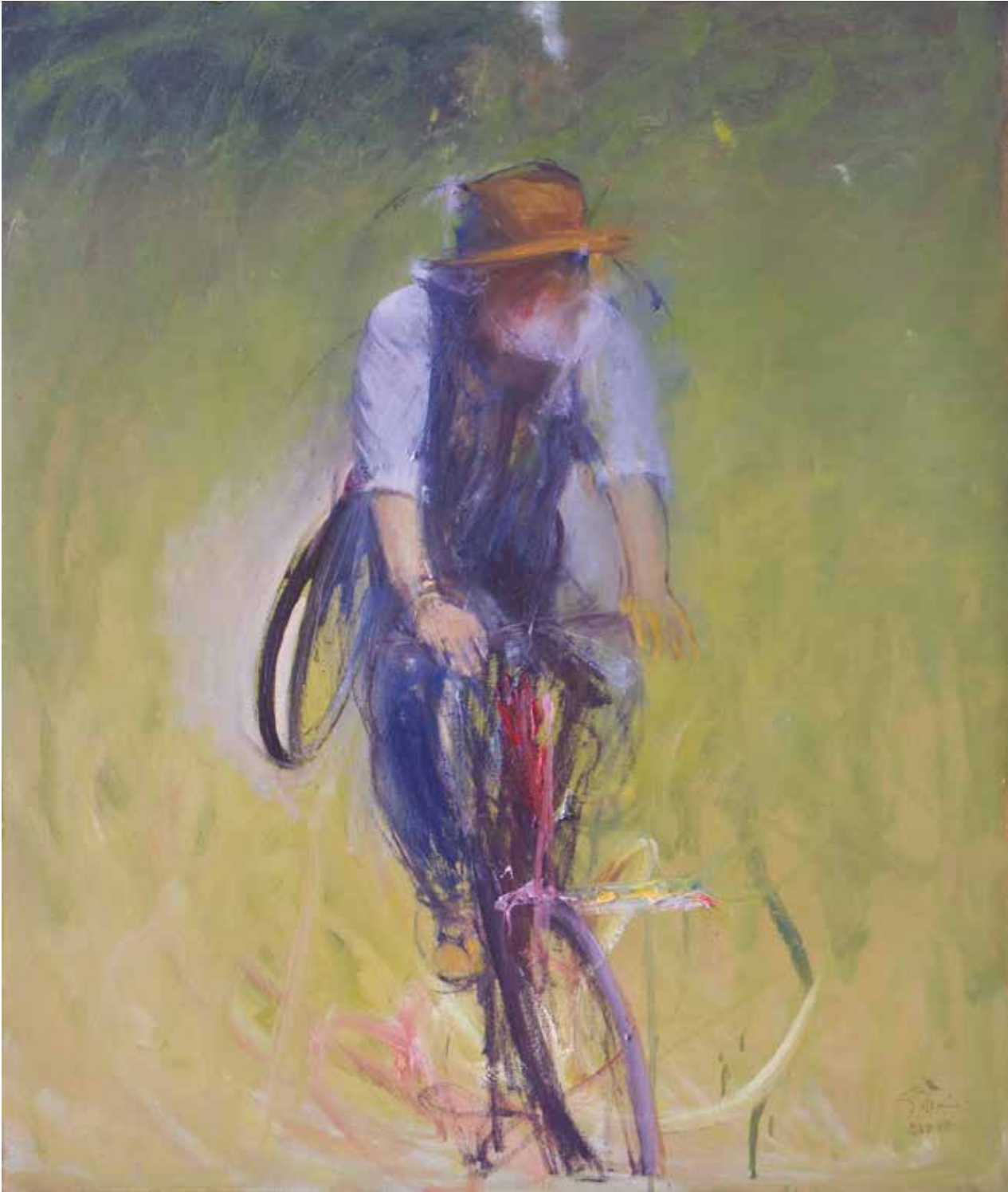
Önarckép biciklin / olaj, vászon, 130x100 cm, 2017

resés és a befogadás/visszatérés izgalmas, egyben fájdalmas stációit láttatja a képsorokban. Generációs problémákat, a kisebbségi lét dilemmáinak vetületeit, a tradicionális lépcsőházból való menekvést fogalmazza meg az allegorikus élettörténetekben. Szabadságra, produktív vagy kreatív gondolkodási folyamatokra vágyás szimbóluma a vastárgy. Szellemi, erkölcsi és fizikai értelemben definiálható a művekben megfogalmazott szándékszabadság. A léthatárokat feszegető alkotó festményein a megjelenő jelentéskörök szignifikánsan vannak jelen. Az ellágyuló