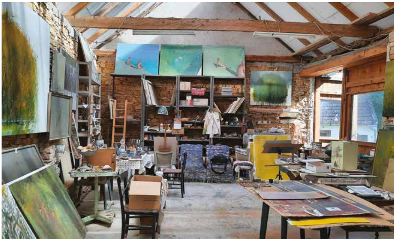
A lókúti Pajta-Art

tást nem tűrő dacot szimbolizálja. Szajkó a távoldás-közeledés élményével perlekedik, s az ősbizalom aspektusainak megismertetésére törekszik. Metaforákkal dokumentálja a látvány pillanatait. Fotografikus, élményű jelbeszédében a kerékpár térbeli helyzetéből az aktuális lelkiállapotok, útirányok olvashatók le. A bezárt ajtók előtt ácsorgó, lámpaoszlopnak támaszkodó – a képnézővel szemben álló – kerékpár ízlelgeti a megindulás nyugtalanságát. A vázvörös izzása még a sorskeresés hevületét jelzi, mely szín a bolyongások során barnás-szürkés földszínre változik. A vándorúton a jármű mindig távolodik, így annak hátulsó, parázsló prizmjája kerül a középpontba, ez egyfajta segélykérésnek, helyzetjelentésnek fogható fel. Beazonosító jel hátramaradottaknak.