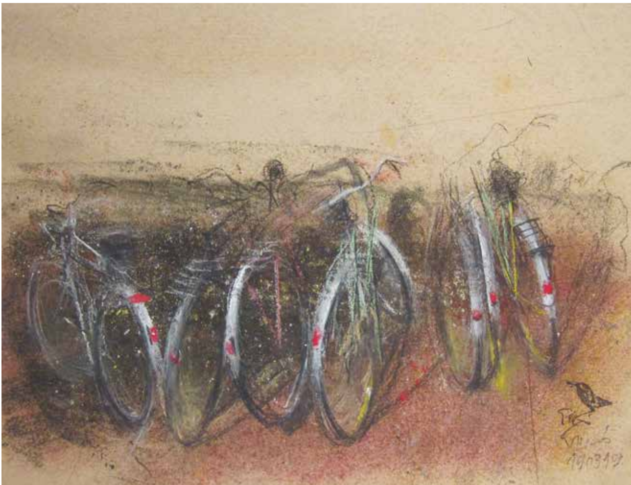
A művész a tárgyakba szellemült lét rétegeit fejtegeti, így teremtve meg újra és újra a lélektárgy mítoszát.

Szajkó jelszerű művészetében markánsan van jelen a kerékpár ábrázolása. A mindig mozgásban lévő útkereső alkalmatosságnak mozdulatlan pillanatait örökíti meg a festő. Ezt az elgondolkodtató idődimenziót szerepelteti képeinek középpontjában. Ebben az ismételt jelrendszerben érzékletesen idézi