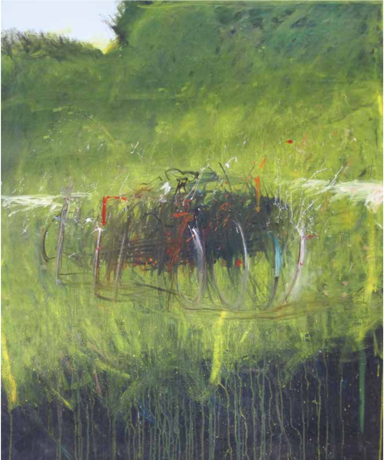
Biciklik zöldben / 120x100 cm, olaj, vászon, 2019

karakterisztikus önkifejező gesztusrendszere felülírja, és képeinek gondolatisága megzabolázhatatlanul töri át az emberi képzelet határait. Gyengéden nivellálva ügyel a részletekre, s mindezeket a piktorális csodákat a Szajkó-képekre jellemző színvilággal erősíti. A befelé forduló meditatív lelki tereket meleg terra-színekkel jellemzi, melyek a természet közelségének nyugalalmát is érzékeltetik. A penészzöldek, a kopott munkáskabát-színek, az okkerek, a fáradt levendulák, a pernyeszürkék, az ánizskékek, a sárfeketék,