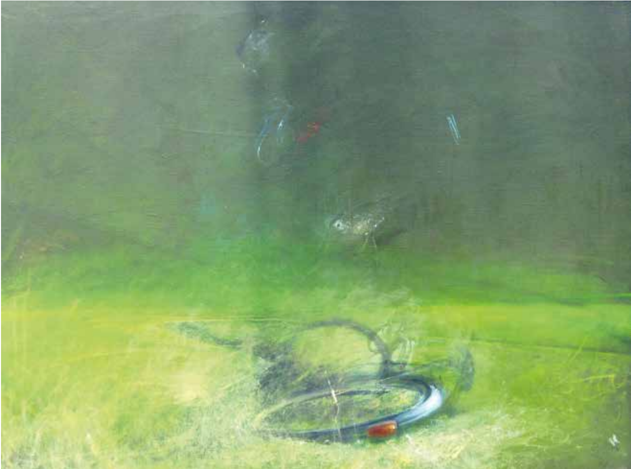
Fekvő bicikli / 100x120 cm, olaj, vászon, 2005

nyugalmát, a vágyódásokat, a kirekesztettséget, a tartózkodó boldogság tünékeny pillanatait. Heves módszerességgel kutatja az élet történéseit. A megélt élményeket egyfajta logikus rendszerben, asszociatív motívumokkal rajzolja papírra. A külsőségek nem érdeklik, a lényegre kutatja szakadatlan. A művész a tárgyakba szellemült lét rétegeit fejtegeti, így teremtve meg újra és újra a lélektárgy mítoszát. Szajkó lélekvádoroltatási élményében az önmegismerés és a megmérettetés áll. Megrendítő szakrális merészséggel, szenvedélyesen festi a rezzenéstelen csendet, s közben szembesül az Isten adta létezéssel.