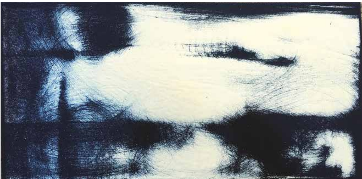
Lassú víz / 30x15 cm

– Huszon valahány éve a tűz-zománccot választottam alkalmazott technikámul. Több okból is. Egyrészt