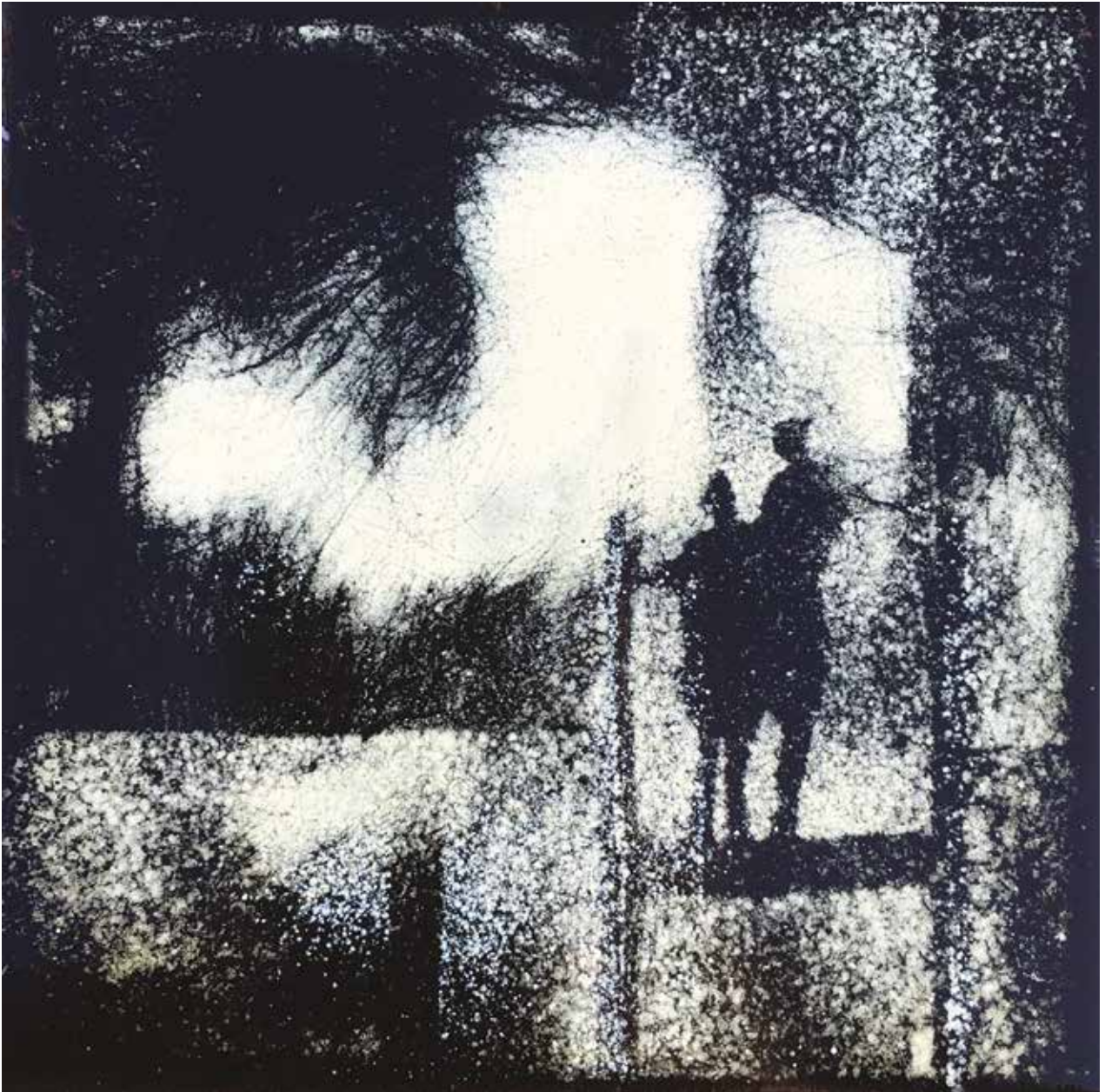
Kilátó / 15x15 cm

előreláthatóan, részben nem kiszámíthatóan színében, felületében, vonalai tekintetében is nyerhet és veszíthet. Minden égetés során. A kemencében az ő felépítettsége, a hőfok, az égetési idő és a kémia törvényei szabják meg, milyen metamorfózison megy át többszörösen, míg végül késznek mondhatom. Egy nagyon inspiratív anyag és folyamat ez. A képpel együtt lélegzem én is. Alkotóként olyan lelkülettel dolgozom, mely szerint a fémlemez érintkezési határfelület fizikai- és magasabb valóságok között. A fátolszerű vékonysággal, rétegről-rétegre felfestett áttetsző felületekbe többnyire természetelemű kifejeződések, alakok, arcok íródnak.