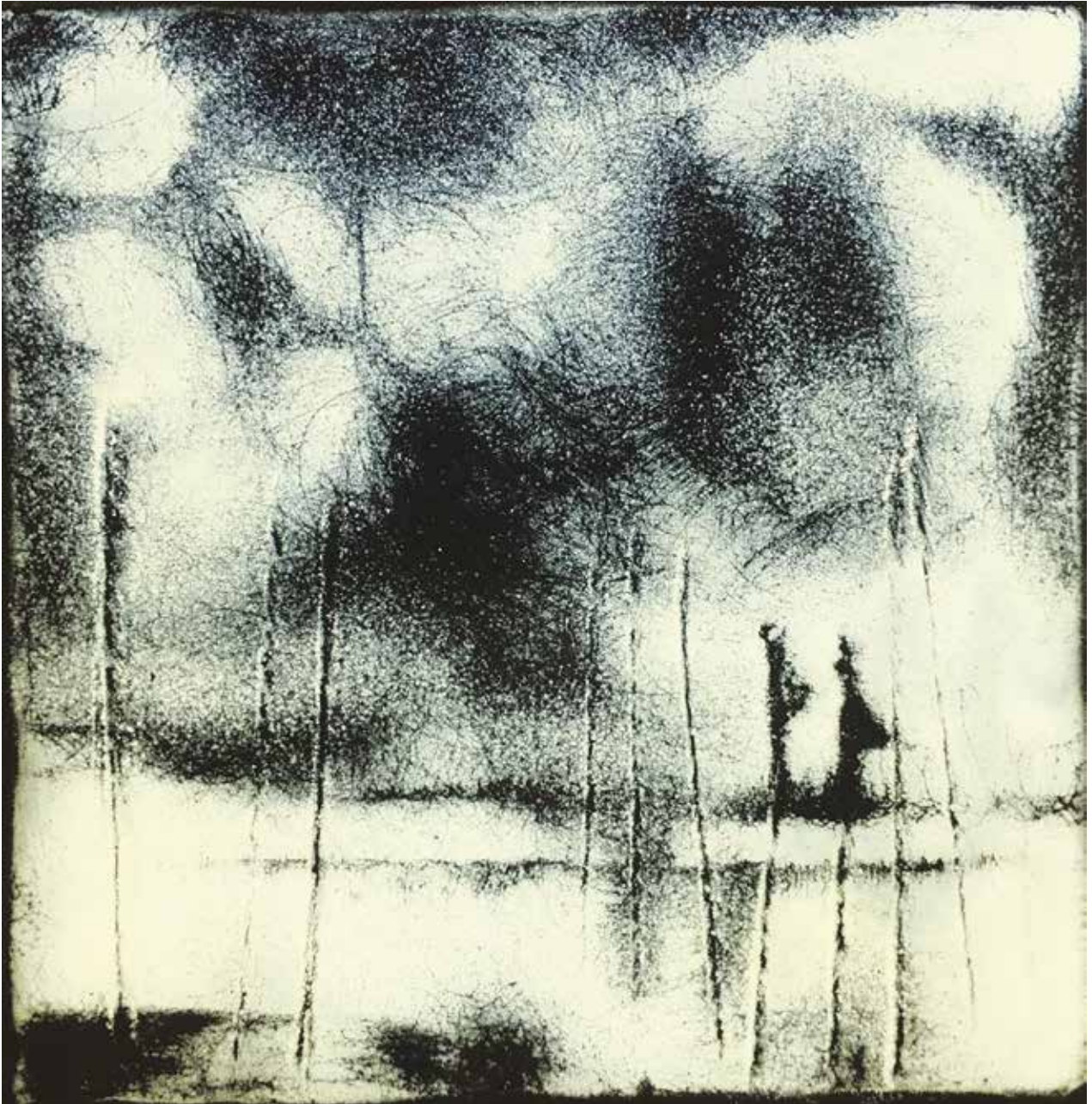
Visz az út / 15x15 cm

– Amikor nem a téma hív alkotásra, akkor az anyag. A réz és vaslemezek még kiaknázzható lehetőségei. A fekete-fehér sokszínűsége, a zománcbéli színkeverések lehetőségei, a különböző faktúrakísérletek... A zománc precíz műfaj. Hajlok is erre. De nem bánom, ha egy repedés, egy felületi vakfolt, vagy egyéb hívatlan részlet olykor bekerül a képbe. Nem kell, hogy tökéletesen kimunkáltak legyenek a képeim.