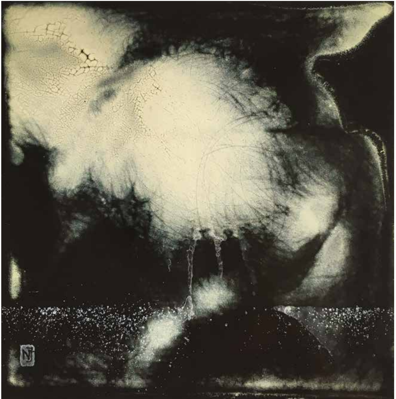
Éji láthatár / 10×10 cm

megfogott a technika különlegessége s a benne rejlő lehetőségek végtelensége, másrészt ez a festészet és a grafika határterülete, ahol a rajzos-festői attitűdömmel a legmozgékonyabban találok fel magam az önkifejezésben. Maga a technika több ezer éves múltra tekint vissza. Az ókori kultúrák szinte mindegyike alkalmazta ötvös díszítőművészetként, s e zománcműves hagyomány ma is él. Iparművészeti területe mellett létezik azonban a XV. századtól indulóan képzőművészeti vonulata is. Ez az úgynevezett festett zománc, vagy festőzománc – amit magam is művelek.