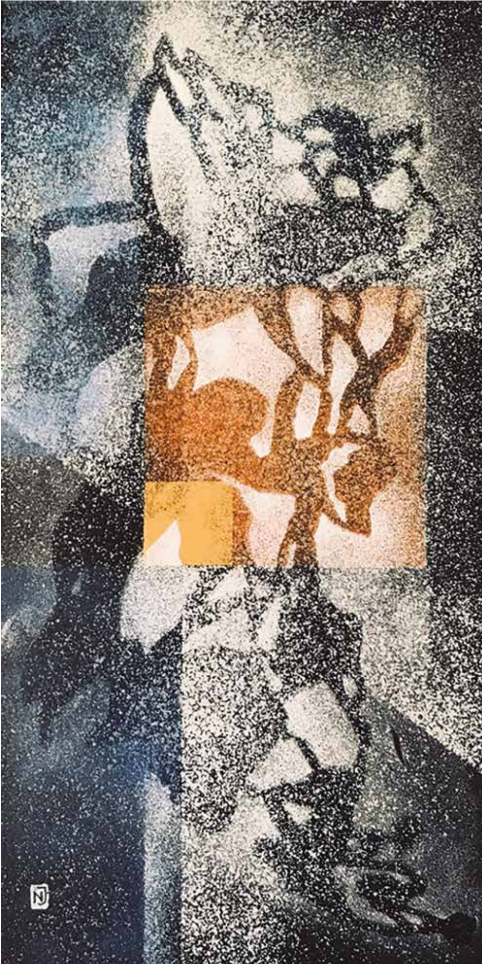
Gubanc van / 15x30 cm