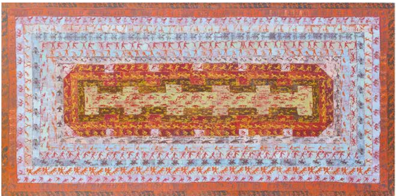
Háború II. / vegyes technika, olaj, vászon, 90x180 cm, 2014