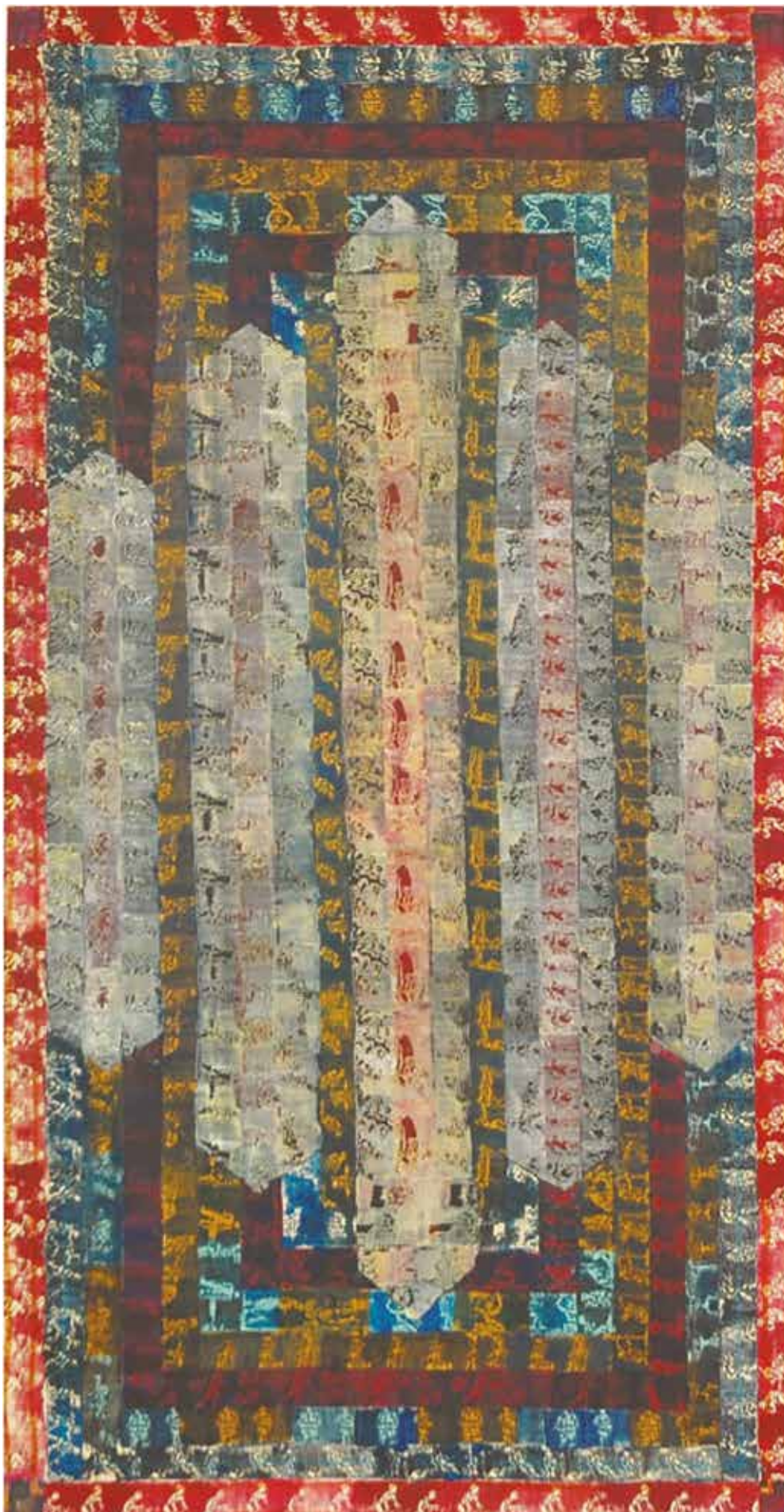
Krónikus / vegyes technika, olaj, vászon, 70x135 cm, 2014