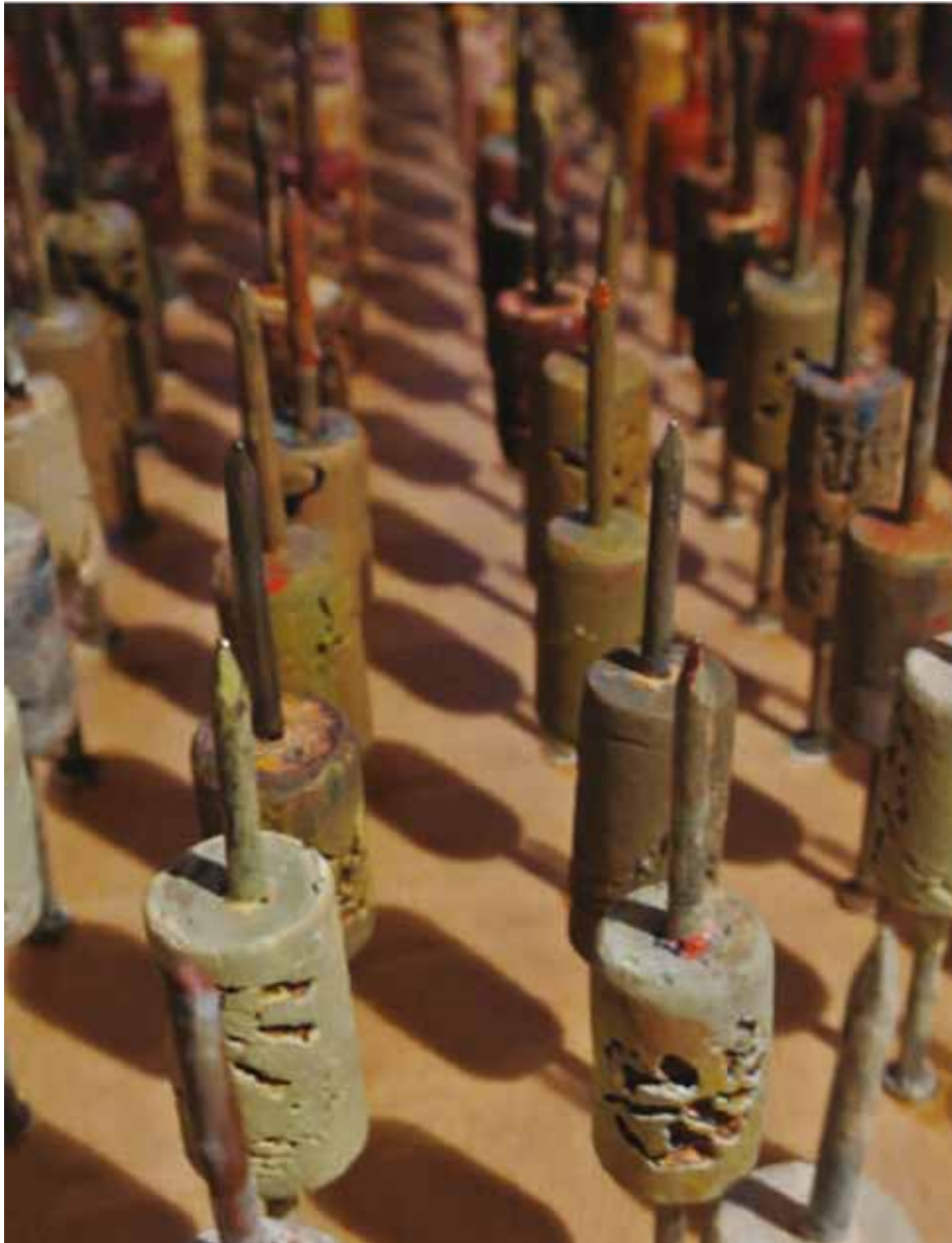
Indulgentia / installáció, 2014