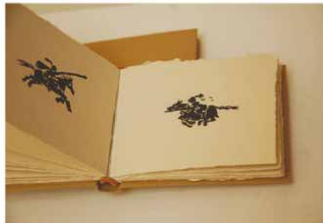
Lelkiismeret vizsgálat - Művészkönyvek / 2014