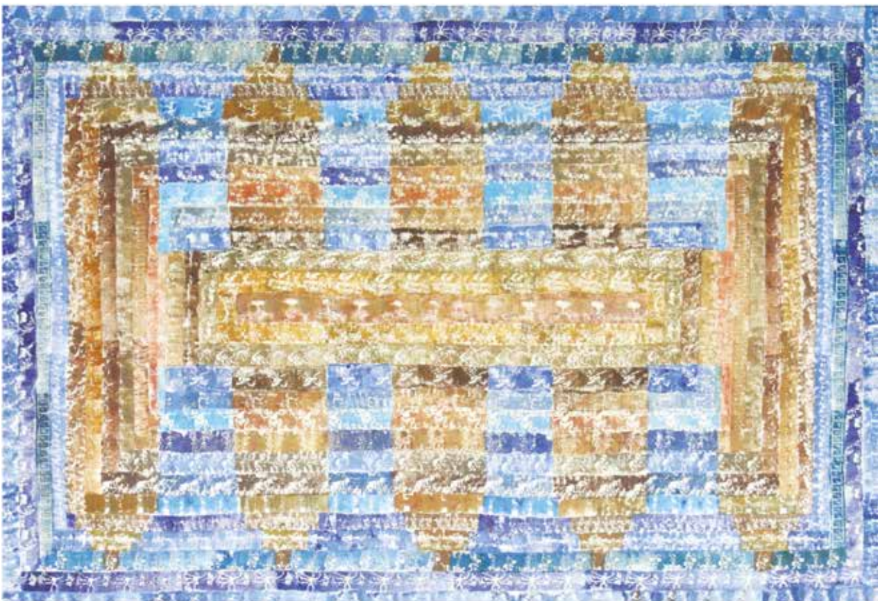
Szintézis / vegyes technika, olaj, vászon, 180x120 cm, 2014