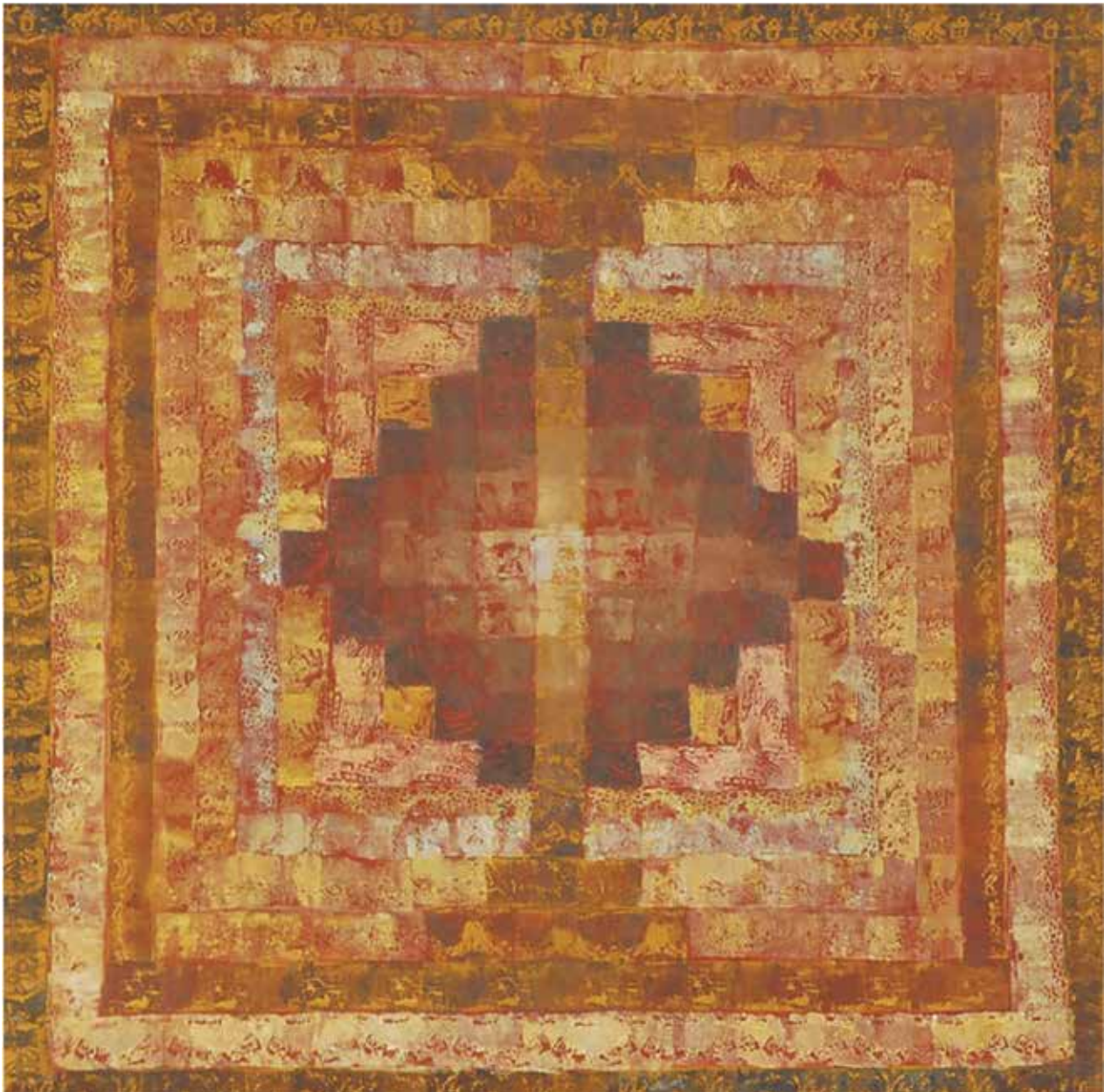
Emlékezet / vegyes technika, olaj, vászon, 90x90 cm, 2014

A kelet a Szövevény-ciklust követően sem eresztette a művészt. Rabul ejtette Méry Beátát talán végérvényesen az a meditatív világszemlélet és az az életbölcesség, amellyel a Távol-Keleten találkozott, indonéziai utazása során. Ősztöndíjasként jutott el oda, erre az ismeretlen vidékre, amely számára inspiráló világ volt, ízeltő egy, az európaiótól