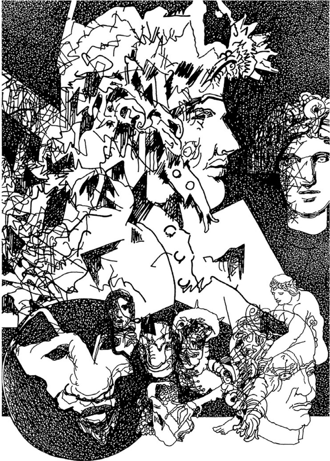
Trianon aniz LXXII. / papír, lemezlitográfia, 2020