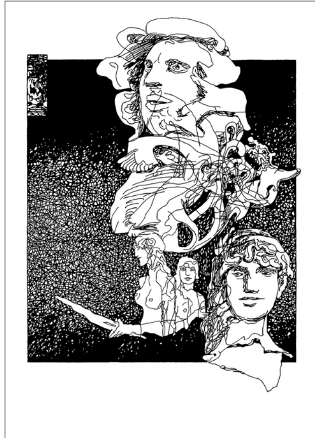
Trianon anizix LCVIII. / papír, lemezlitográfia, 2020