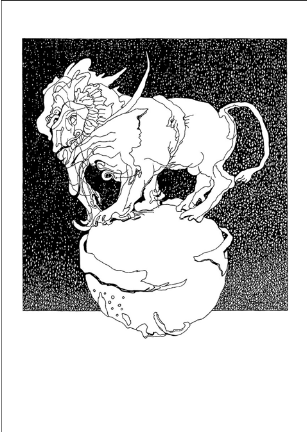
Trianon anizix LXIV. / papír, lemezlitográfia, 2020