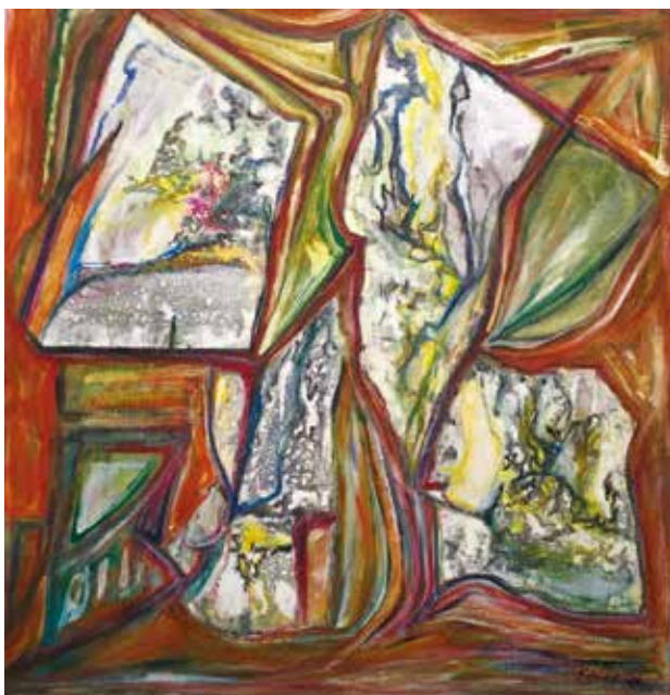
Sipos Endre / Metakozmionok