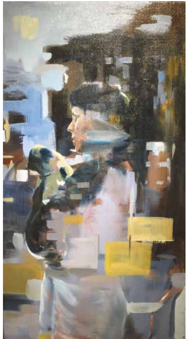
Lajta Gábor / Nő az utcán ölelbel