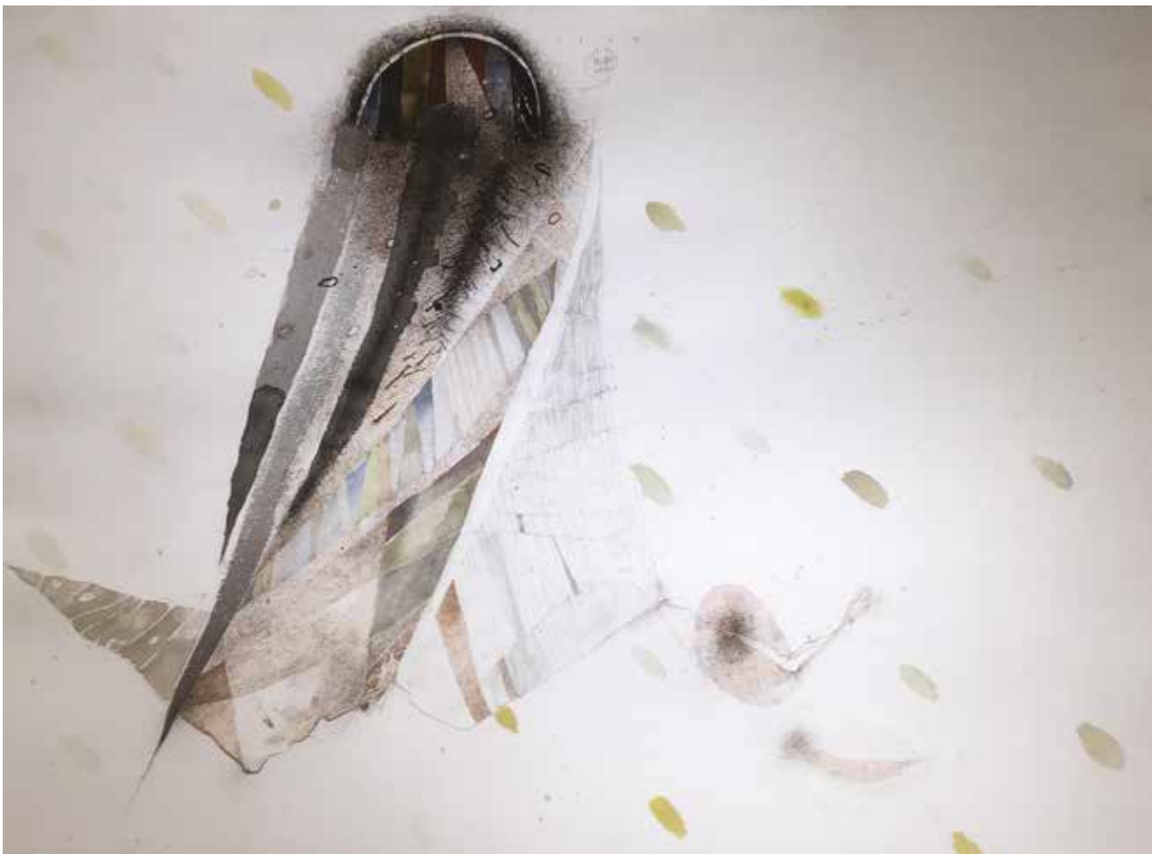
Nagy Gábor / Montenegro (Tájsebek)