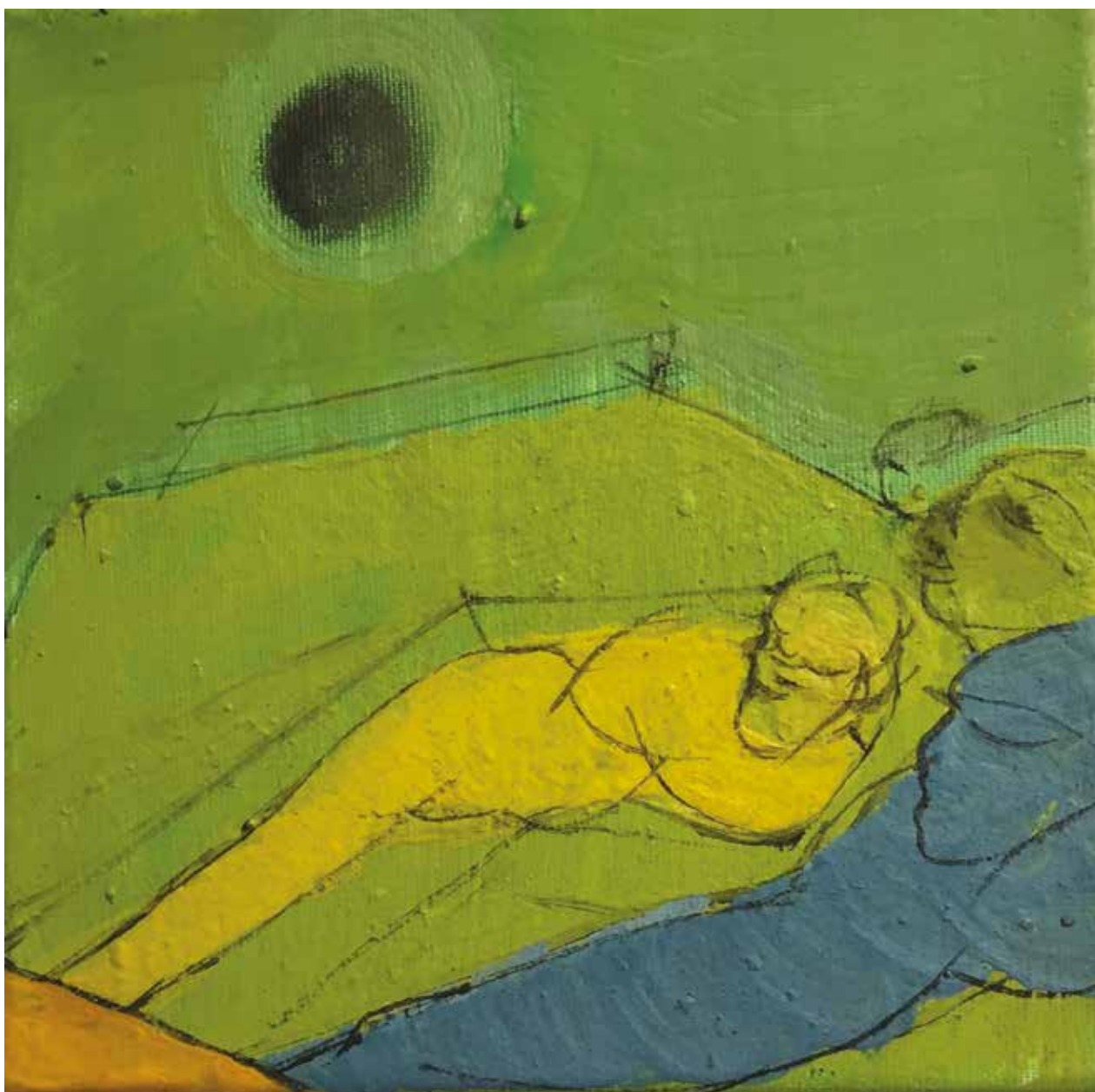
Véssey Gábor / Alvók