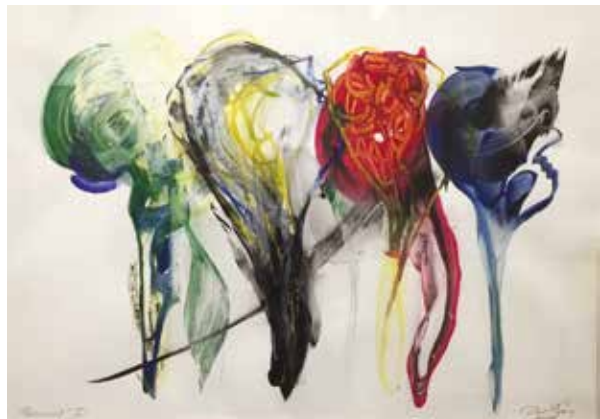
Gábor Áron / Párbeszéd II.