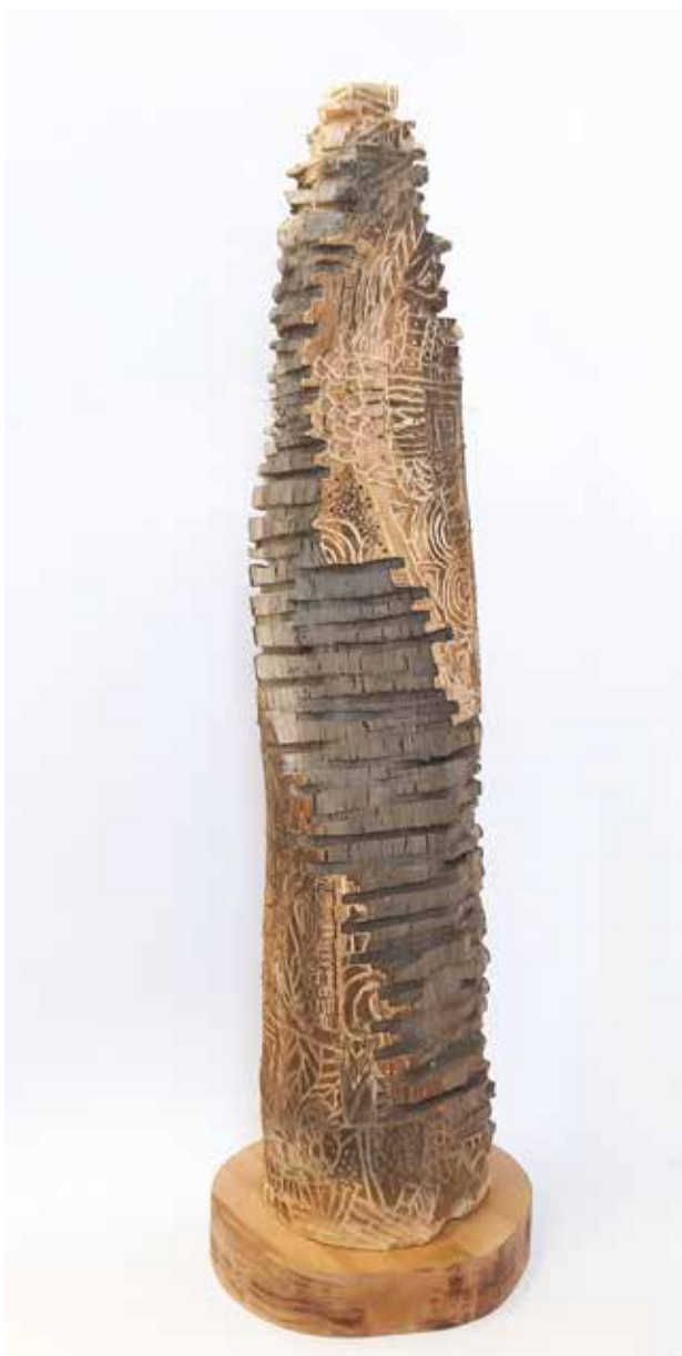
Monyov Glória / Cím nélkül