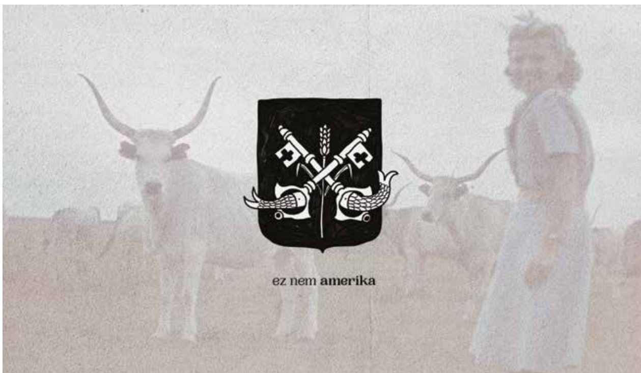
Kincses Endre / Ez nem Amerika