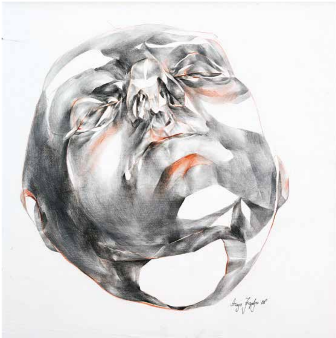
Acsaji Györgyi / Álom 2.