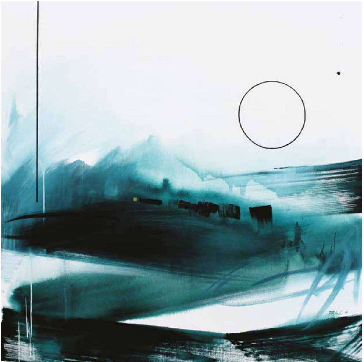
Pesti Emma / Sötét fény