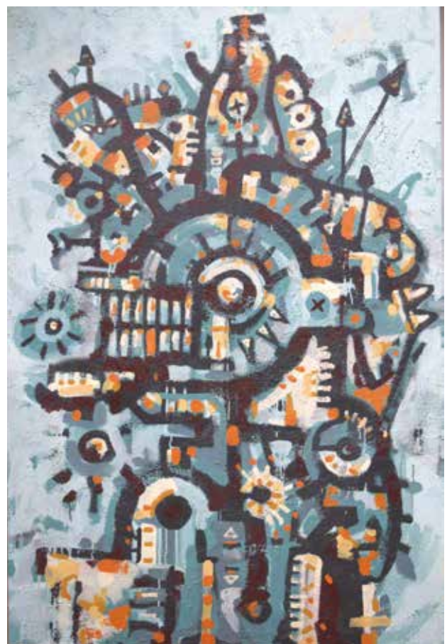
Vass Szabolcs / aminosavas önprogramozó