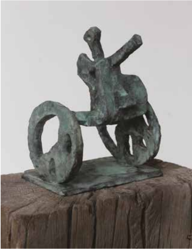
Éliás Ádám / Ló nélkül