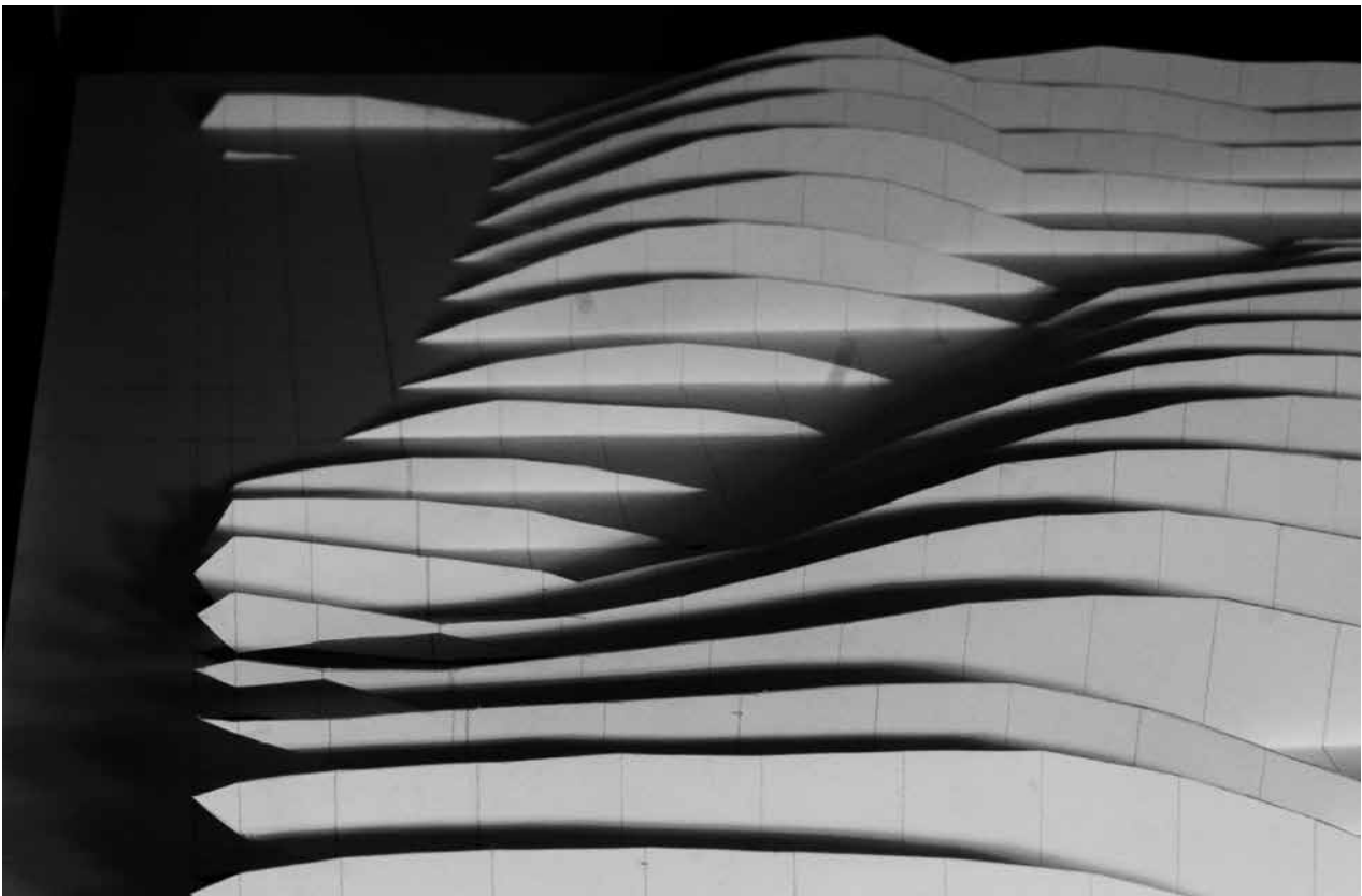
Tarcsi Ádám / SP 3.0

Művészi kérdések és válaszok, párbeszéd-kezdemenyezések, kételyek és biztos kijelentések záporoznak a befogadó elé és felé: mintha egy felbolydult, kaotikus, látszatszerűségekben villódzó világ művészeti tükörcserepeinek összeillesztésre