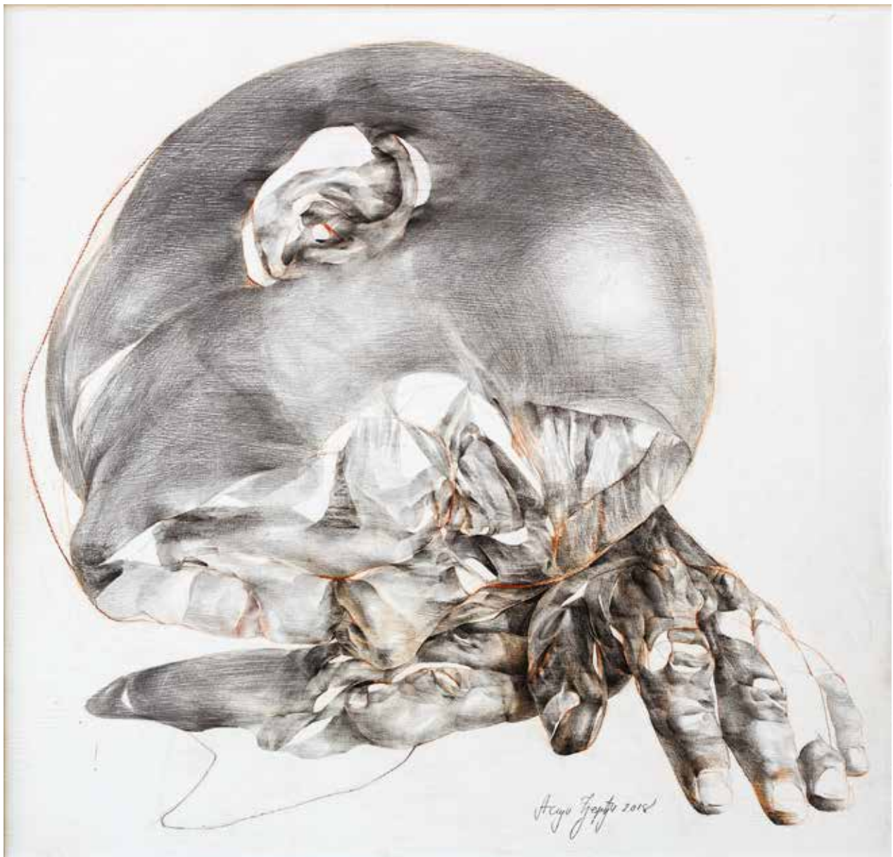
Acsaji Györgyi / Alom 1.