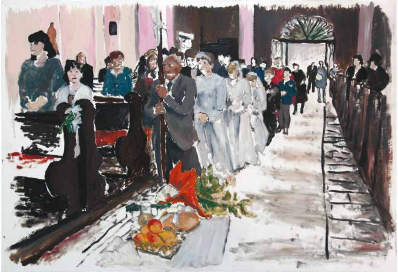
Mazán Anikó / Tér-Idő-Emlék