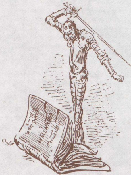
Képeink: Doré Don Quijote illusztrációi

A változó idők több pozitív változást is hoztak. Létrejött a 18 éven felüli diákok alternatív beiratkozási lehetősége, bővült a kedvezményes áron beiratkozók és a térítéses szolgáltatásokat ingyenesen igénybe vevők, valamint az igénybe vehető könyvtárak köre.