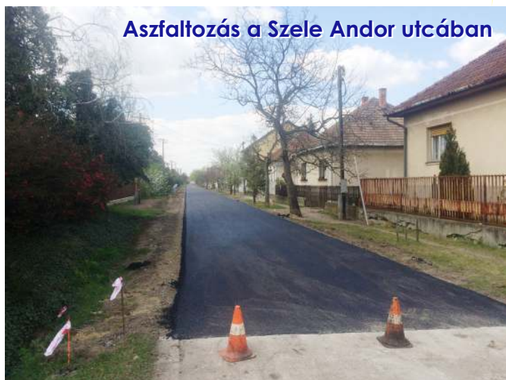
Aszfaltozás a Szele Andor utcában