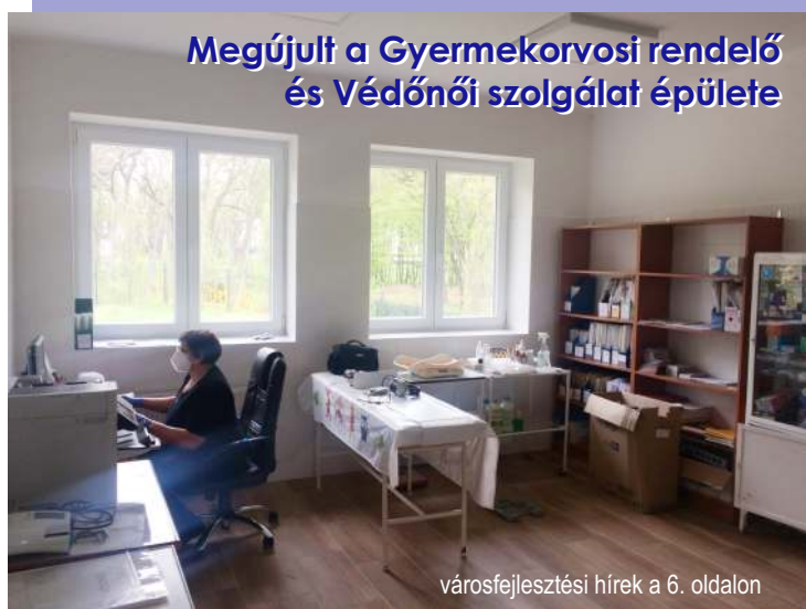
Megújult a Gyermekorvosi rendelő és Védőnői szolgálat épülete