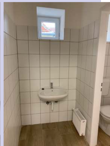
az Arany János utcai Orvosi Rendelő épülete