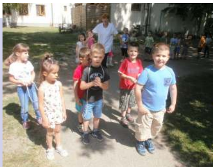
Indul a lovassfogat