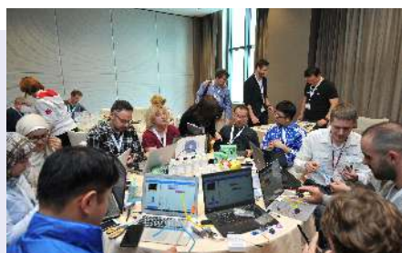
Minden nap volt műhelyfoglalkozás, ahol valamilyen új eszközt próbálhattunk ki. Itt a programozás alapjairól volt szó, ilyen microbitekből 10 darabot kapott iskolánk.

A másik alapvető probléma, hogy az általuk ismert jelekkel, ikonokkal - bármennyire is szeretnének - nem lehet megfelelő szinten kommunikálni. Ez egy nagyon rossz út. A szülők, de még a kollégák egy része is azt hiszi, hogy ezek a gyerekek mindent megtalálnak, amit akarnak, de nem. Önmagában az, hogy nyugodtan elbábrál vele, nem jelent semmit. Nagyon sokat kellene tanulniuk. Most kezdünk rádöbbenni, hogy fogalmunk nincs hová vezet ez a folyamat. Azt nem csinálhatja meg egyetlen iskola sem, hogy nem vesz róla tudomást. Például órák közötti szünetben felügyeletet biztosítok a tanulók számára, vigyázom minden lépését, de a kezéhez nőtt okos telefonon senki nem ellenőrzi, hogy milyen tartalmak között barangol. Se az apja, se az anyja, se én. Nem tudják szűrni az információkat. A magyar iskola egyáltalán nem tanít kritikus gondolkodást. Dániában a negyedikes gyerekeknek olyan feladatokat adnak, hogy egy adott információról döntsék el, hogy helyes, vagy nem helyes. Mi ugyanebben az életkorban Móra Ferenc történeteket dolgozunk fel, ami nagyon szép és értékes, szükség is van rá, de nem tanít a hamis információk kiszűrésére.