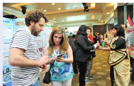
A tanítási piactér - minden tanár bemutatta a saját projektjét, beszélgetett, kérdezett, ötletet gyűjtött.