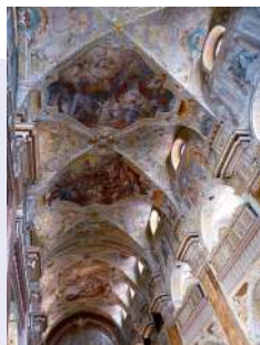
Premontrei Szentháromság-templombelső; Erazmus Schrött illuzórikus freskóival díszítve