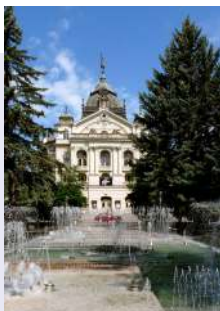
Főtér - Állami Színház, előtérben a zenei hangokra programozott szökőkút vízijátéka