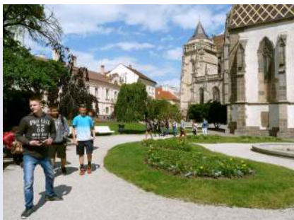
Szent Mihály kápolnánál