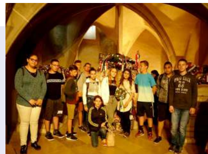
Altemplom, Rákóczi - kriptá; kegyeleti emlékhely