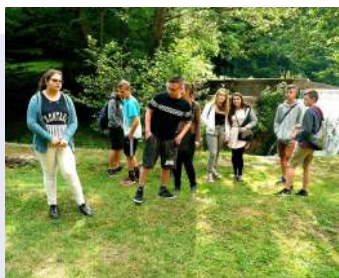
utolsó állomásunk, Jószafeő.