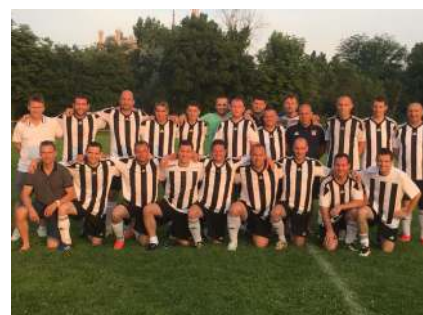
U9 csapat - U14 bajnok csapat - Öregfiúk bajnok csapat