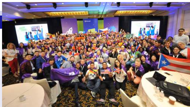
A digitalizáció azt is jelenti, hogy a közösség - már a Föld. Ez a tanári a bolygónké. Tanárok minden kontinensről.

Nem tanulják meg. Azt gondoljuk, hogy megtanulják, de nem. Mondok egy egyszerű példát. Elkezdtem a 3-4-esekkel dolgozni. Ők iskolai szinten nem találkoztak még a digitális eszközökkel, de nagyon mondták, hogy ők már mindent tudnak. A probléma akkor kezdődött, amikor leültettem a gyereket az asztali számítógép elé és nem találta rajta a bekapcsoló gombot, mert a telefont szokta meg. Sikertelen bekapcsolni a gépet, rögtön jött a következő gond, nem nyílt meg automatikusan a youtube. Megmutattam nekik a böngészőt, beírta szépen pontos j-vel, hogy jutub, vagy valami hasonlót. Meglett a találat, mert a google algoritmus a okos és felismeri. Elindult a youtube. Beírta a keresőbe, hogy depacsító, kb. ezzel a helyesírással. A google megingt okos volt és ismét megvolt a találat. A gyerek büszkén jelezte, hogy tessék, másfél perc alatt megvan, amit kerestek. És ők tényleg azt hiszik, hogy értenek hozzá. De nem ő ért hozzá,