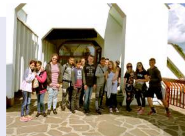
3 km-re a Baradla-barlangtól, az Aggtelek -Domicai barlangrendszer szlovákiai bejáratánál