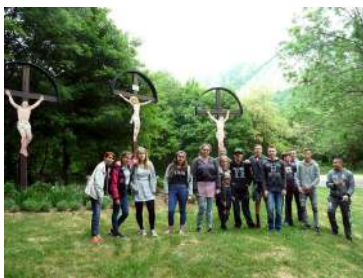
Bélapátfalvai apátságtemplom, Kálvária-domb; háttérben a Bélkő, Bükk hegység