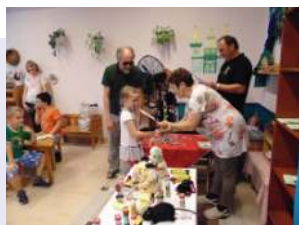
Hanna átveszi a díjat