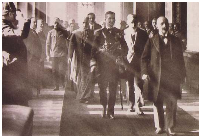
Horthy érkezése az Országháza 1920. március 1-én, mögötte Huszár Károly kormányfő

Horthy Miklós kormányzósága alatt istenfélő, antibolsevista