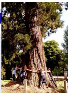
Jászói apátság többszáz éves mamutfenyője (hatan kellett hozzá, hogy átérjék)