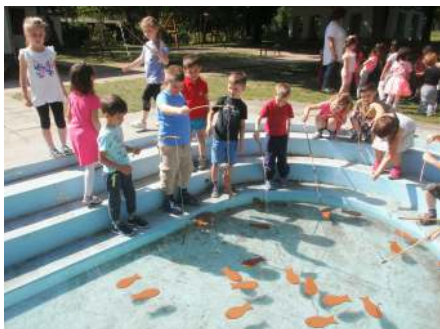
Horgászok - pecások