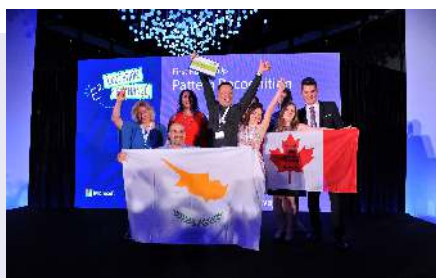
A program része, hogy a csapatok kidolgoznak egy-egy projektet, és ezeket 6 kategóriában versenyeztetik is. A mi csapatunk megnyerte az egyik kategóriát.