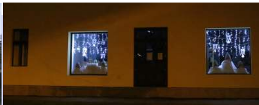
Ilyen volt, ilyen lett eddig