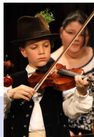
Turai népzeneész növendékek (Unger Balázs)