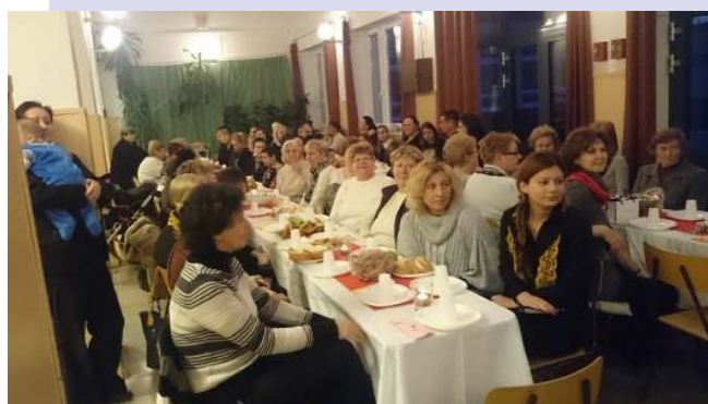
Az iskolai híryanagot összeállította: Heine Éva