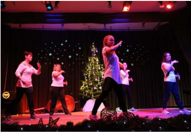
Turai Zumba csoport (Ilkó-Tóth Andrea)