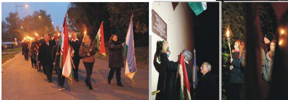
A fáklós felvonulás és ünnepélyes koszorúzás pillanatai