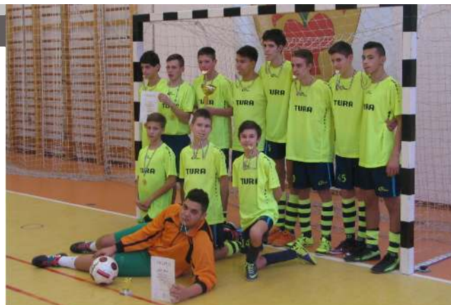
TTTT Kupa U16 1. helyezett csapat

Mindkét eseményről a következő lapszámban részletesebben írunk majd. Az érdeklődőket kérem kísérik figyelemmel a márciusi Turai Hírlapot..