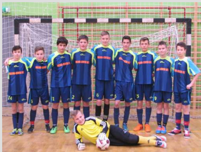
Hevesy Tura teremfoci csapata IV. korcsoport

A Diákolimpia teremlabdarúgó bajnokságra ebben a tanévben a 4. korcsoporttal nevezünk.