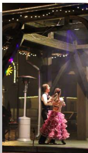
Mindenki karácsonya ünnepi pillanatok