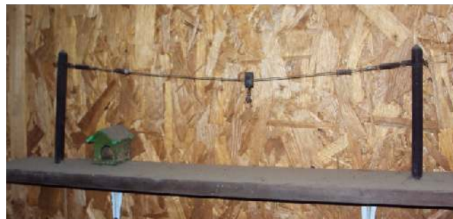
A „blokír” - futólánc makettje - itt felső drótvezetéssel

Nagyon aktuális a kérdés. Azok az emberek, akik területőrzésre, vagy jelzőrendszerként használták, ezzel együtt láncon tartották a kutyát, a jogszabály alól úgy próbáltak kibújni, hogy elengedték, vagyis közterületre bocsájtották ezeket a kutyákat. Azt tanácsolnám mindenkinek, aki ilyen helyzetben van, hogy sem saját, sem mások testi épségét ne veszélyeztesse ezzel, ez nagyon buta dolog. Ha egy ilyen kutya kikerül területre, automatikusan neki fog támadni az első embernek, aki az útjába kerül, legyen az akár gyermek, felnőtt, idős, postás, bárki. Lehetséges megoldásként azt javaslom, hogy ne tartsa helyhez kötötten rövid láncon a kutyát, ha szeretné megtartani. Erre van kitalálva például a blokíron (futólánc) való kutyatartás. Ez egy 10-20 méter hosszú - a földön, vagy két oszlop között elhelyezett - drótsodrony, amire rá van csatolva egy 2-3 méteres lánc, ezen a kutya le-föl megfelelőképpen tud mozogni. Tud kommunikálni a beérkező emberekkel, sokkal nagyobb a látótere a portára, közelebb van az emberekhez. Idővel szocializálódik, megnyugszik. Nem szabad azt sem figyelmen kívül hagyni, hogy ezzel a megoldással feladatát is sokkal jobban el tudja látni. Egy fix 4 méteres láncra kikötött kutya előtt akár 1 milliméterrel is el lehet sétálni anélkül, hogy meg bírjon fogni, de ugyanez egy blokírnál kiszámíthatatlan, ami hatékonyabb fellépést biztosíthat pl. egy illetéktelen behatoló esetén.