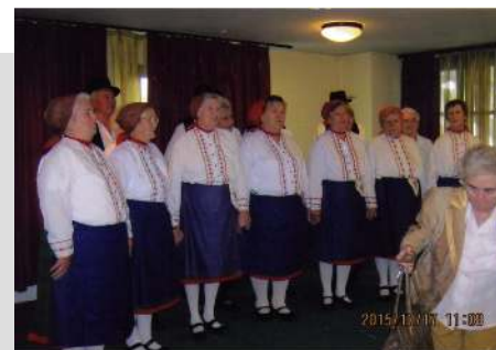
Egerben, a Nyugdíjas Dalkörök találkozásán