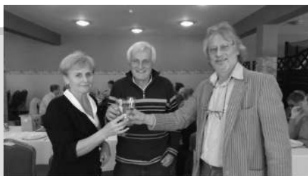
a szervező trió