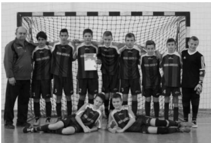
A győztes csapat!