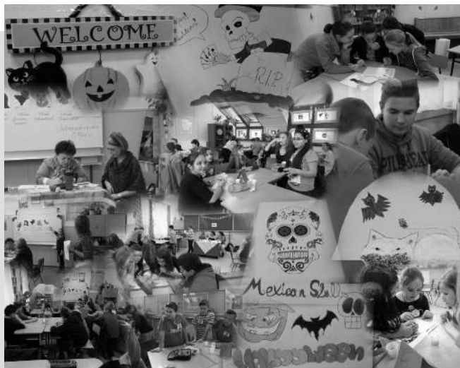
Halloween vetélkedő montage