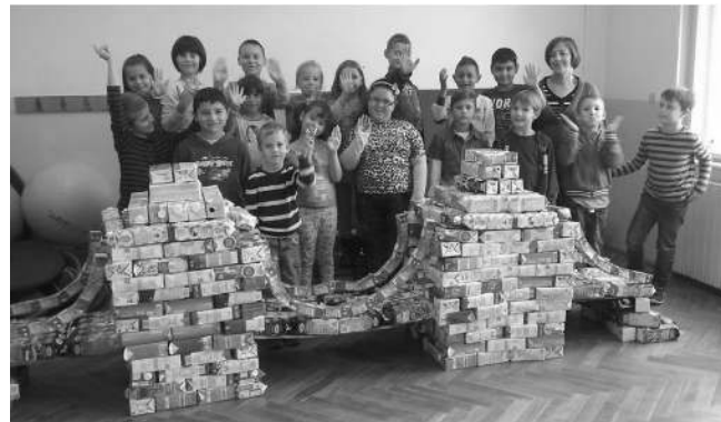
A Tetra Pak "Kezdjétek nyertes az évet!" nyereményjáték, kreatív építmény kategóriájának nyertes műve. Lánchíd, a Turai Hevesy György Általános Iskola 2.b. osztályának interpretálásában.

A TETRA PAK Magyarország általános iskolásoknak meghirdetett versenyén a „Kreatív építmény” kategóriában a 2. b osztály tanulóinak látványos Lánchídja lett a nyertes . Nyereményük 70 ezer Ft , melyet kirándulásra, koncertre vagy múzeumlátogatásra használhatnak fel.