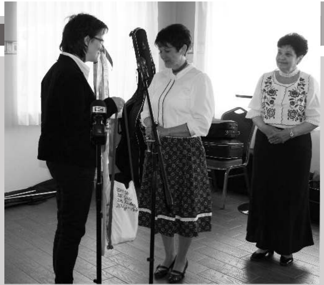
a Győr-Ménfőcsanakai Világosvár óvónői átadják a vándortarisznyát a Többsincs Óvoda és Bölcsőde intézményvezetőjének

„Megtisztelő, hogy megmutathattunk óvodásaink mindennapi életéből egy kis szeletet. Minden „nehézség” ellenére gyermekeink természetes, nálunk megszokott, óvodás életét kívántuk láttatni. Azt, ahogyan óvodásaink a mindennapokban, a szabad játék folyamatában az óvó néni által felkínált néphagyományt ápoló tevékenységekbe bekapcsolódnak. Hosszas előkészítő és szervező munkát követően egyedi módon valósult ez meg nálunk, hiszen még soha nem volt arra lehetőség, hogy a találkozó résztvevői természetes közegben, az óvodai csoportszobákban foglalkozás közben a gyermekeket is meg tudták tekinteni. 260 vendégünk volt, nemcsak Magyarországról, hanem Erdélyből és a Vajdaságról is érkeztek vendégek. Eleinte elég merész vállalkozásnak tűnt megfelelő színvonalon lebonyolítani a találkozót, de most már büszkén mondhatom azt, hogy sikerült, megérte a közel egy éve tartó szervezés és a rengeteg befektetett munka.