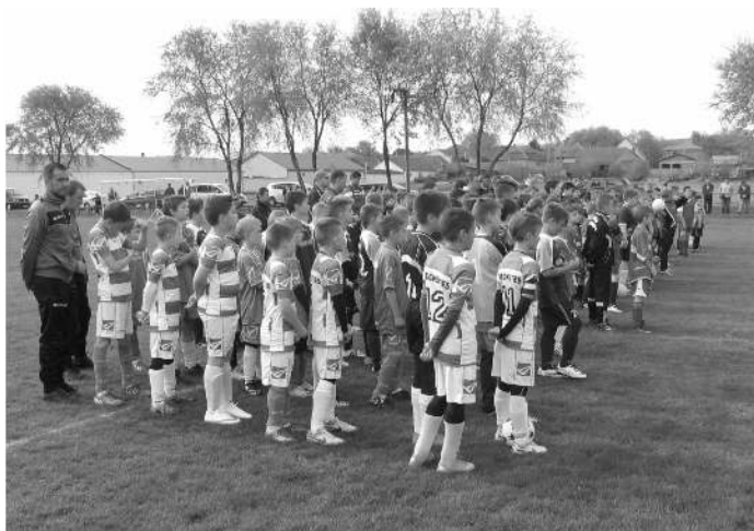
U11 BocsikTorna - Galgahévíz 2015.04.26.