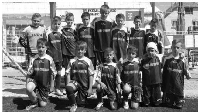
DIÁKOLIMPIA MEGYEI DÖNTŐ - III. korcsoport