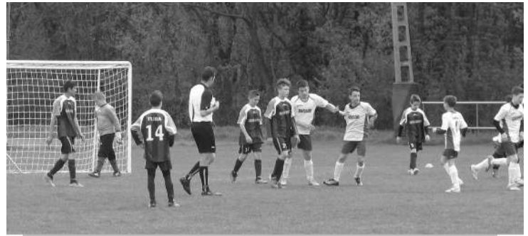
U14 Tura - Sülysáp