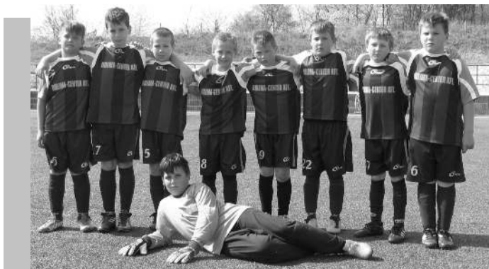
DIÁKOLIMPIA MEGYEI TERÜLETI - II. korcsoport