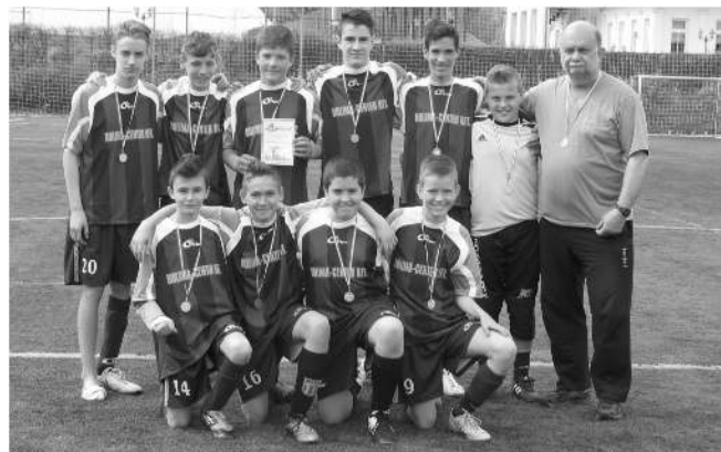
DIÁKOLIMPIA MEGYEI TERÜLETI - IV. korcsoport