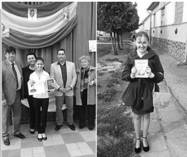
Tankerületi szavalóverseny - Hévízgyörk