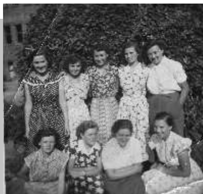
Baár-Madasi Gimnázium (alsó sor jobb oldal)