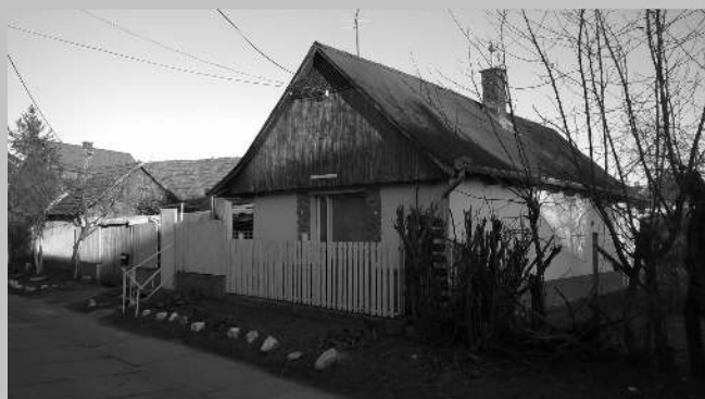
szülői ház a Kónya soron

kitette azt az ablakba és az öregek sámlikon ülve hallgatták a híreket az utcán.