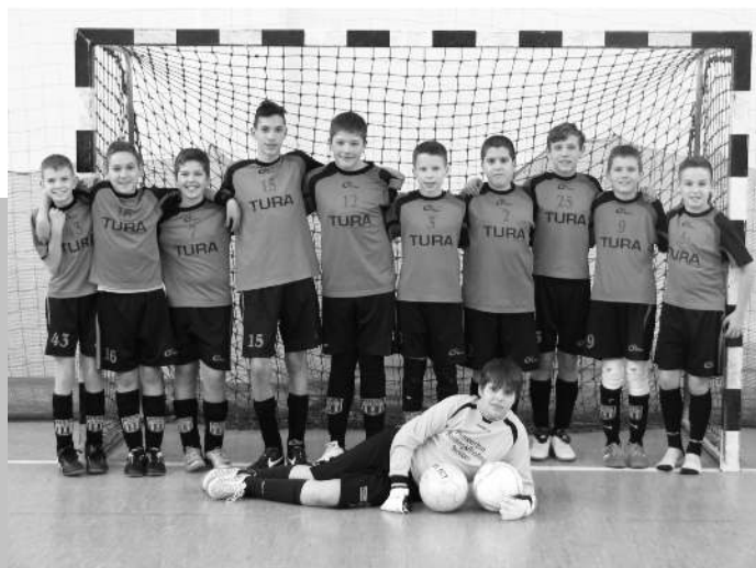
2001-es csapat, Tetőtechnika Kft. Kupa Kartal