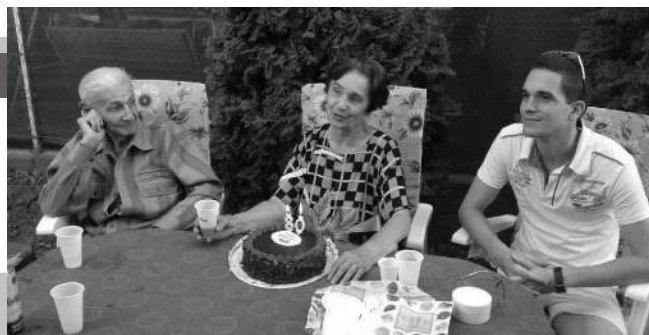
80. születésnap családi körben

Apámnak kellett a villany, mert az esperes úr cúgos cipőit másnapra, a nagymisére meg kellett javítania. Sokszor hajnalig verte a faszöveget a kis suszter műhelyében. Először az öreg Szaszakótól tanult. Majd ezután pedig egy budapesti belvárosi cipésztől tanulta meg a szakma csínját-bínját és ott kapta meg a mesterlevelét. A turai tanítók trotil sarkú cipőit gondos figyelemmel megjavította. Ortopéd cipőket is készített, a sámfákat előre kiépítette, tudta kinek hol volt bütök, vagy sarkantyú a lábán és a flepnit oda szögelte azért, hogy az első perctől kezdve kényelmes legyen a cipő a tulajdonosának. A cipészkéllékeket Pestről szerezte be. Emellett azért közéleti ember is volt, mert apámnak a háború alatt már rádiója volt,