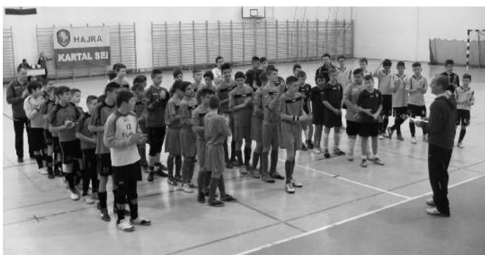
Tetőtechnika Kft. Kupa 2001-es korosztály