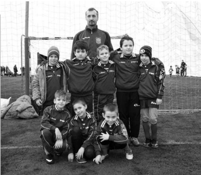
U9 - Téli Kupa