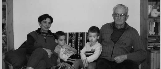
Fent: a család egy része • Lent: az unokákkal