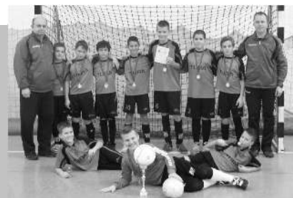
A III. korcsoportos csapat