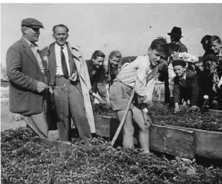
Gyerekek a Galgamenti TSZ-ben