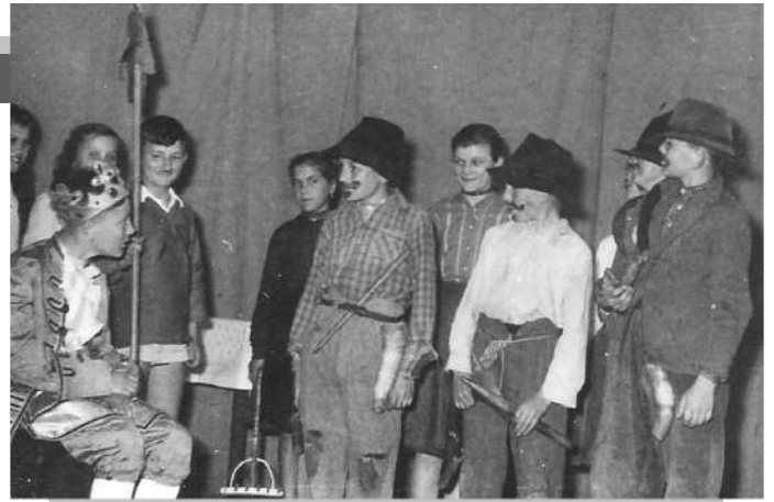
Az iskolások mesejátéka