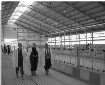
Az új takarmánytároló és az új istálló bejárása