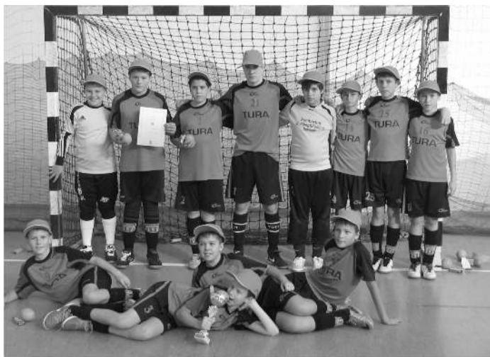
Balaton Ottó kupán győztes csapat

December elejére lezárultak a szabadtéri események. A tél folyamán hagyományosan a tóalmási sportcsarnokban és turai iskola tornatermében tartjuk edzéseinket és egynapos tornákon veszünk részt. Csak a két ünnep között tartunk egy rövid szünetet. Mindenkinek Békés, Boldog Karácsonyt és Élményekben gazdag, Sikeres Új Évet Kívánok!