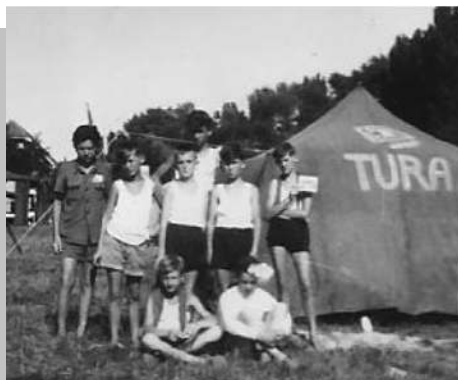
Megyei táborban (Zamárdi)