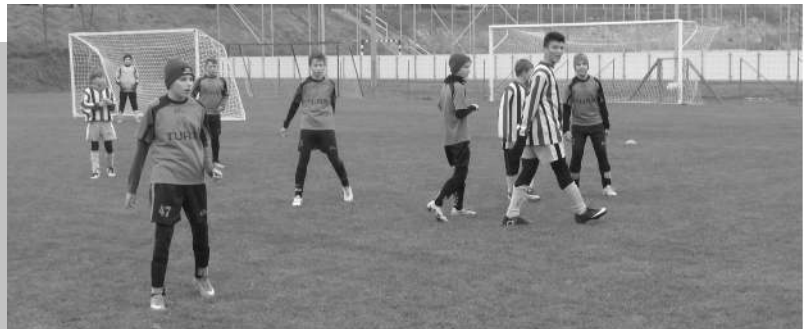
2014.11.16 U13 Tura - Hévízgyörk