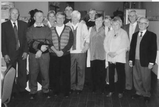
A szakközépiskola első végzősei