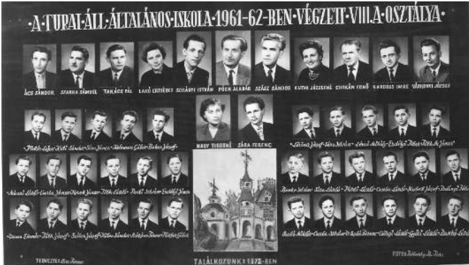
A turai Általános Iskola 1961-62-ben végzett VIII.a osztálya

Az archív képanyagot Szarvas László nyugalmazott tanár Úr bocsátotta a szerkesztőség rendelkezésére. A fotók többségét Takács Pál készítette. Mindkettejük közreműködését köszönjük!