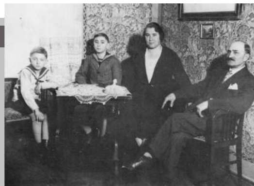
Szüleivel és bátyjával

földekekkel, állatokkal, halastóval, fácánneveldével, erdővel. A báró alkalmazásában lévő cselédek száma közel 250 fő volt. Nekik a Haraszt-pusztán házakat építettek és a báró iskolát létesített nekik a tanyán.