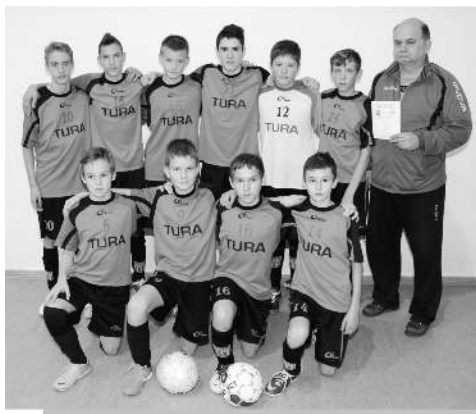
A IV. korcsoportos csapatunk