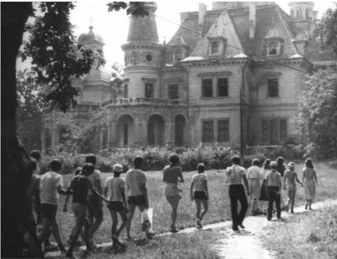
Gyerekek a kastélyparkban