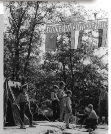
Járási tábor bejárata Síkfőkúton (1964)