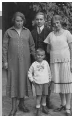
Milti édesanyjával, bátyjával és nővérével