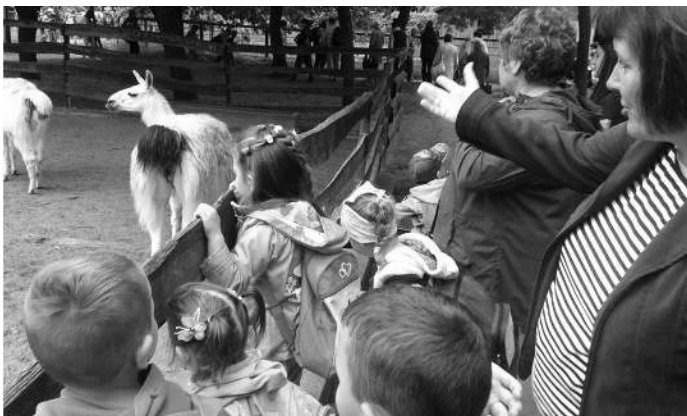
a Jászberényi Állatkertben

A kisebbek úti célja az idén a Jászberényi Állatkert volt, Nagyon izgalmas, élménydús nap volt ez számukra. Különösen a medveetetés és az állatsimogató tetszett a gyermekeknek. Hátizsákból ebédeltek, majd a játszótéren tombolták ki magukat. Fagyfaltozással zárták ezt a csodás napot, melynek a szülők is részesei lehettek.