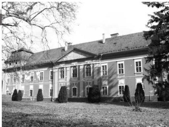
A jászói premontrei monostor épülete