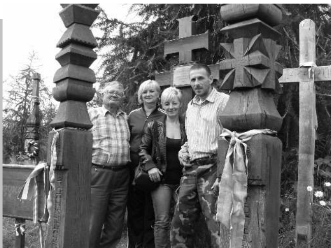
Nyerges-tetőn a keresztfelújítás után