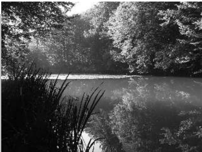
A Tapolca folyó romantikus völgyében a nagy halastó szépségében gyönyörködhetünk, melynek létrejötte a 15. századba nyúlik vissza.

Kedves jászói és szentimrei barátainkkal legközelebb Szent István ünnepén találkozhatunk Turán.