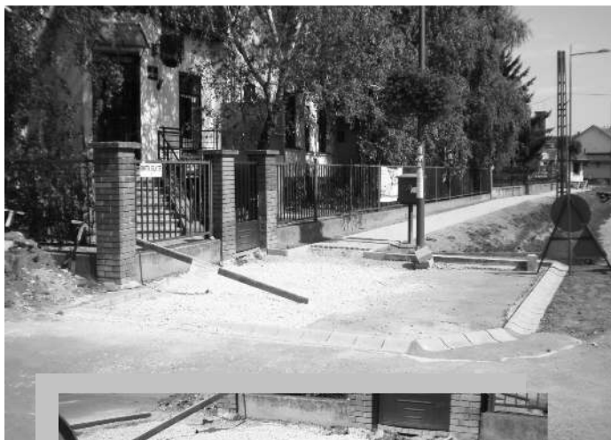
Fotó: Tóth Anita