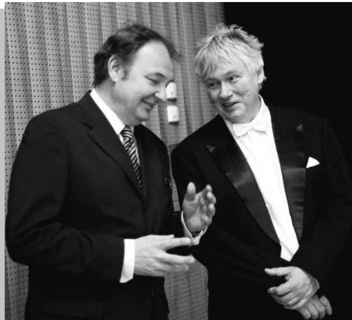
Kocsis Zoltánnal a Magyar Nemzeti Filharmonikusok főzeneigazgatójával

Az amerikai kultúrában és művészettörténetben különleges, valaha banknak készült épületben, a New York-i Capitolban rendezték meg. Az ünnepélyességét kicsit az Oscar-díj átadához tudnám hasonlítani. Ami engem is meglepett,