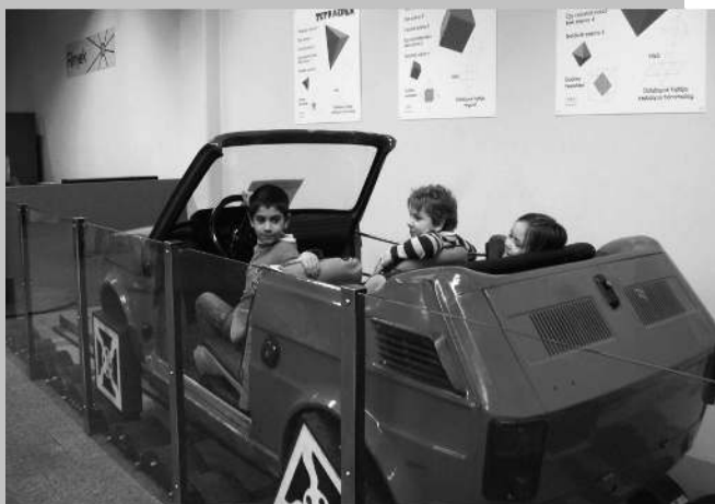
A csodák palotájában