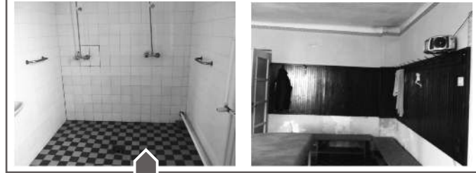
Ilyen volt - ilyen lett