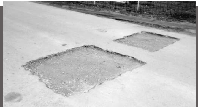
A Magdolna utca elején felvágott aszfaltot az Önkormányzat azonnal kijavította az "elkövetővel", de örökre nyoma marad a réteg megbontásának.