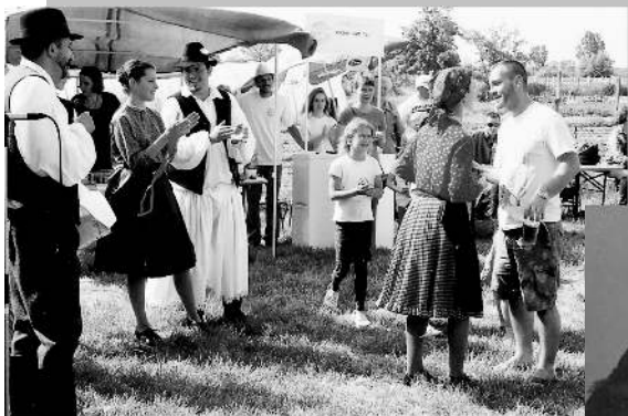
Ezek a képek is szerepelnek az albumokban