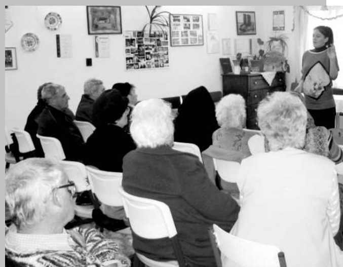
Az Időskorúak védelmében előadás képei