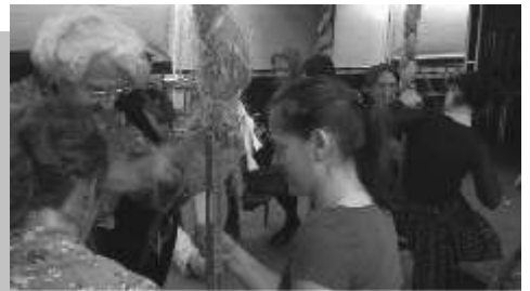
Fonósházi hangulat elevenedik meg a néptáncscsoport próbáján: az adatközlők tanítják a lányokat a guzsallyal és orsóval bánni