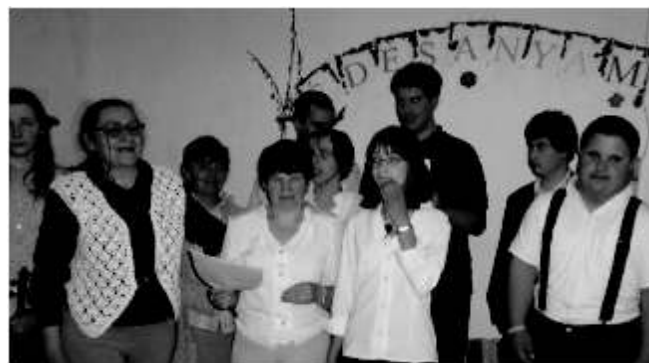
Anyák napja alkalmából ünnepelünk

Az alapítvány szociális tevékenységet folytat, segítséget nyújt a Turán és környékén élő fogyatékos fiataloknak, lehetőség szerint próbáljuk őket önálló életre nevelni. Szüleiket támogatjuk gyermekeik életvezetésében, valamit igyekszünk segítséget nyújtani a fiatalok tanulási és munkavállalási lehetőségeinek felkutatásával. A napi foglalkoztatás a nevelést, oktatást, ismeretterjesztést, képességfejlesztést foglalja magába.