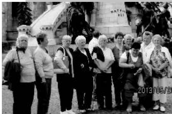
Kolozsváron a Mátyás király szobor előtt, háttérben a Szent Mihály templom