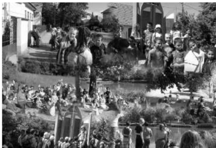
Túra - montage