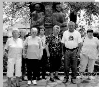
Tamási Áron síremlékénél Farkaslakán