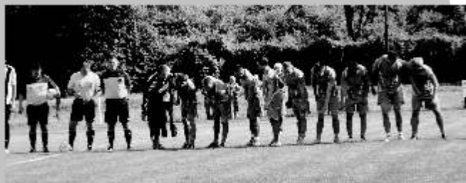
NB.III -as felnőtt csapatunk