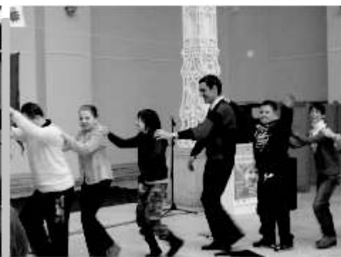
Vidámságban sosincs hiány!