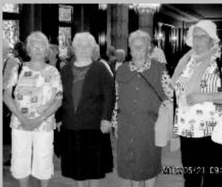
A marosvásárhelyi Kultúrpalotában