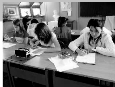
Az általános iskolai beszámoló összeállította: Heine Éva