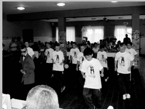
PSY és a tánc csoport

Ezúton is szeretnék köszönetet mondani, mindazoknak akik hozzájárultak a bál sikeréhez: