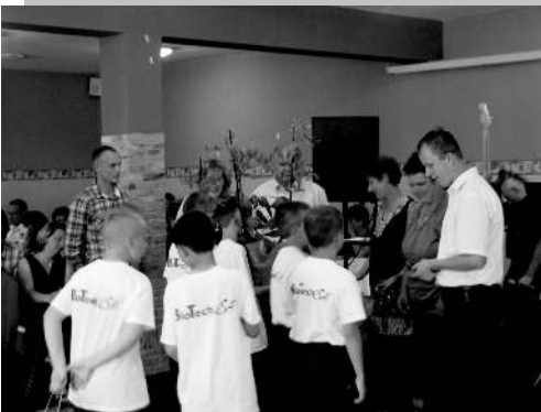
Az edzők és feleségeik köszöntése

Köszönjük minden jegyet váltó bálozónak a részvételt. Bátran állíthatom, hogy a bál remek hangulatban és rendben zajlott le.