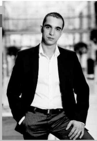
2013 január - La Femme magazin