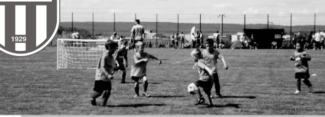
U-7-es csapatunk a Bozsik tornán