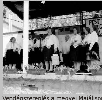
Vendégszereplés a megyei Majálison