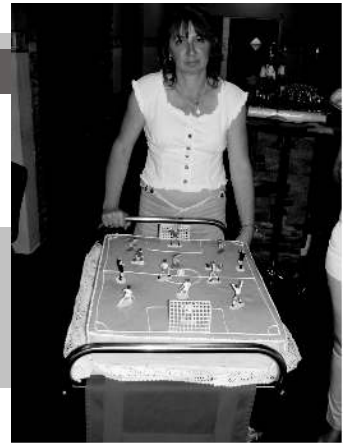
A hatalmas torta és készítője

A szülők kezdeményezésére és összefogásával 2013. május 11-én 18 órától került megrendezésre az a Jótekonysági bál, amelynek bevétele a 7-13 éves gyerekfocisták (jelenleg 53 fő) további fejlődéséhez szükséges sportszerek, sporteszközök vásárlását, sportrendezvények költségeinek finanszírozását fogja szolgálni.