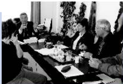
AZ UTOLSÓ ELLENŐRZÉSEK

A KIVITELEZÉSI SZERZŐDÉS ALÁÍRÁSÁNAK PILLANATAI