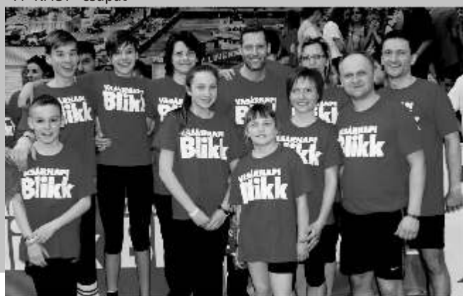
A "NAGY" csapat