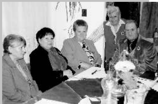
Nőnapra és Március 15-i ünnepség