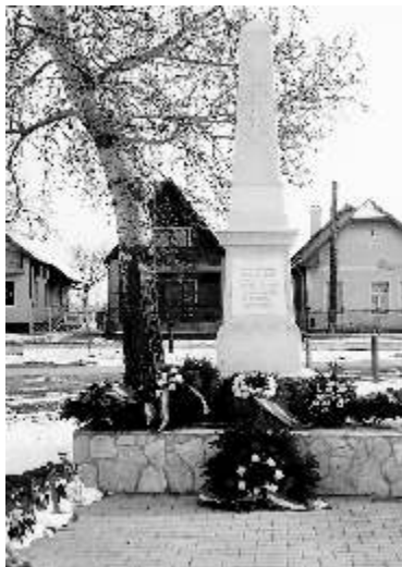
A megkoszorúzott emlékoszlop