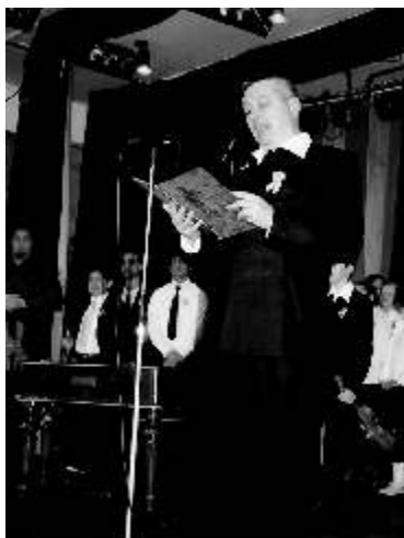
Szendrei Ferenc, városunk polgármesterének ünnepi beszéde