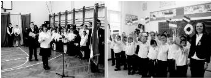
Március 15-ei ünnepség a Hevesyben és az Iskola úton (2.b)