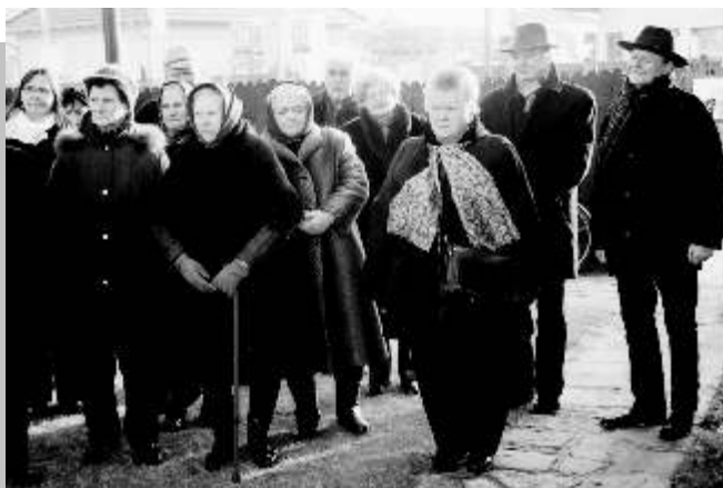
A megemlékezés egy meghitt pillanata