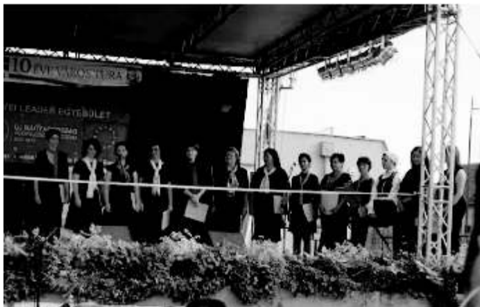
2011 - Híresvárosi Vigadalom, Főtéravató

Elsősorban Turán léptünk fel, de szereplünk már Galgahévízen is a Kórusfesztiválon, Budapesten az Autómentes Napon, és nagy sikerrel szereplünk Csíkszentimrén.