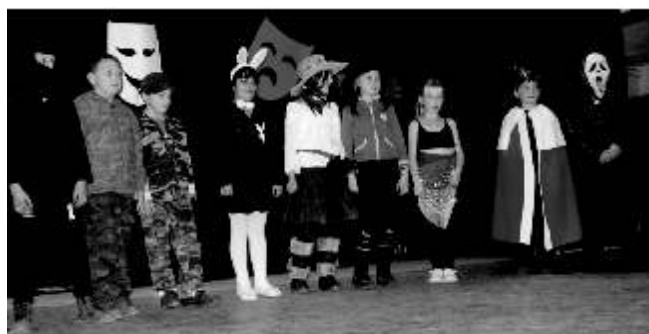
Jelmezből a 3.-4. évfolyam