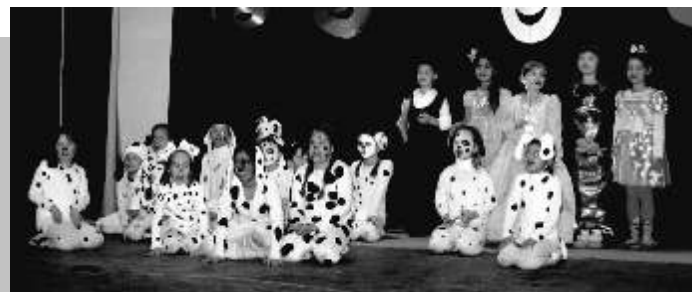
Jelmezből az 1.-2. évfolyam