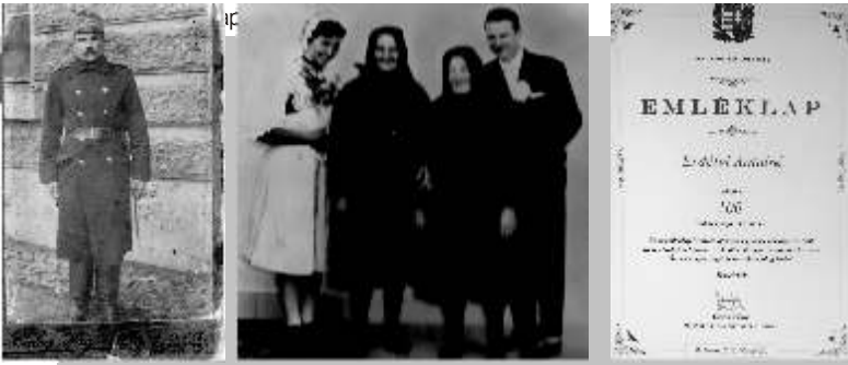
Édesapám katonaként az I. világháború előtt