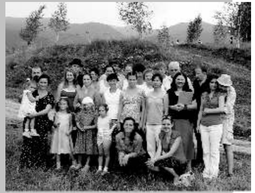
Csíksszentimre - a Hargita lábánál