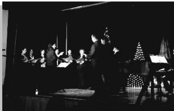
2011 - Karácsonyi műsor