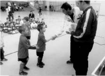
"Lurkóink" a Vonnák kupán

Tura, Dabas, Sülysáp, Jászberény A, Jászberény B, Nagykáta A és Nagykáta B.