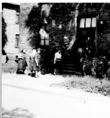
Auschwitz-ban a TSZ csapattal