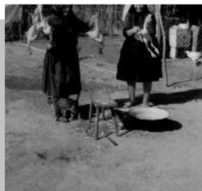
Lagzi előtti kopsztás