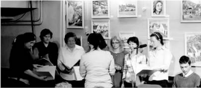
Cserhát művészkiállítás megnyitóján