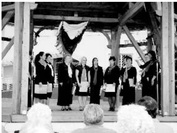
2012 - Bárdos Napok a zenepavilonnál