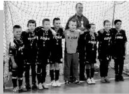
A Budakalászon győztes U-10-es csapat