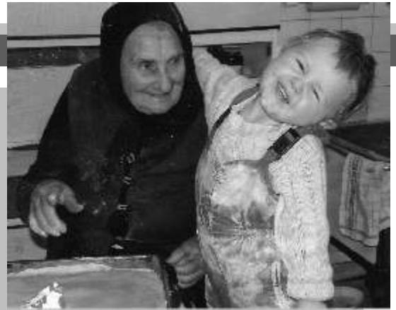
A mama a dédunokával