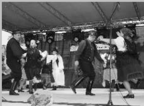
Híresvárosi Vigadalom, 2012