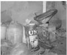
A megmaradt kis daráló

Azt is elvitték a tsz-be. 1964-ben jött egy rendelet, hogy újra válthat ipart, aki nyugdíjas. Azt mondta apuka, reszkirozzunk meg egy kisebb darálót. Ő ezt a semmittevést, a magányt nem bírta. Mindig emberek között volt, állandóan jöttek ide hozzánk. Ekkor már 72 éves volt. A nyugdíjáról le kellett ehhez