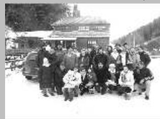
Gyimesi szilveszter 2011