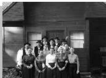
Büdösfürdői Ifjúsági Napok