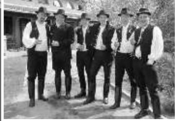
Húsvét, 2012 Locsolkodás