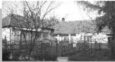
A Szaszko féle ház

Elmentem az iskola igazgatójához megkérdezni, hogy miért nem veszik fel, hiszen megígérték tavaly, hogy előfelvételis, nem kell újra vizsgáznia. Erre azt felelte az igazgató, hogy nem tudtam, hogy falun is vannak még királyok, akik beleszólnak mások életébe. Ő sem tehetett semmit, vizsgázni kellett, mert a minisztériumból jött egy tiltó papír mindig. Így került be a főiskolára három évet veszítve. 1970-ben végzett Esztergomban.