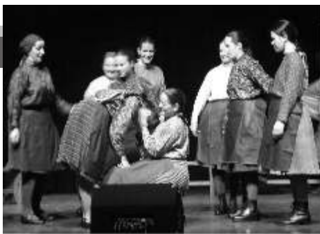
2012 Bonyhád, minősítő

Alapos gyűjtőmunka és számos személyes visszaemlékezés lejegyzése után született meg a „Turai fonó” hagyományörző jelenet, mellyel elindultak