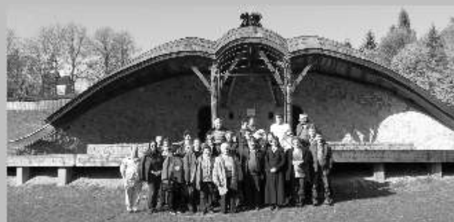
A csíksomlyói szabadtéri oltárnál