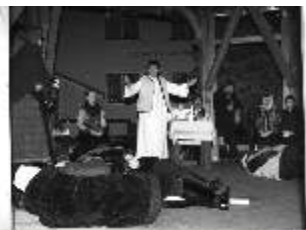
Betlehemes 2011, Mindenki Karácsonya