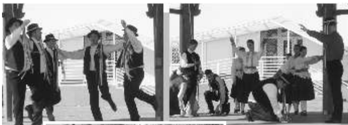
Táncjáték 2012 Március 15.

A 2012-es batyusbálon már egy összeszokott csapat mutatott be Galga menti táncokat, majd a március 15-i szabadtéri nemzeti ünnepen katonai toborzót és történelmi táncjátékot. Húsvétkor a legények népviseletben vonultak vödörrel locsolni a lányokat, s persze asszonyokat is, hisz akad abból is néhány a táncosok között. A tizenéves középiskolások jól megférnek a harmincas-negyvenesekkel, hisz a hagyományörzés egyik lényeges eleme épp a generációk összetalálkozása egy közösségben.