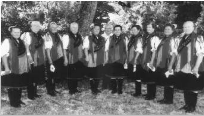
Őszirózsa Nyugdíjas Egyesület Népdalköre

Hála Istennek, ebben az évben mind a 110 klubtagunkat megtartotta életben. Nem kellett senkitől örökre elbúcsúzni. Mozgalmas volt az esztendő. Szűkös anyagi helyzetünkben is igyekeztünk kikapcsolódást teremteni, az élet adta gondokból, bajokból egy-két órára kiragadni szépkorú tagjainkat, pár vidám, búfelejtő órát szerezn.