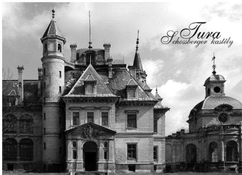
A turai Schosberger-kastély egy mai képeslapon

A turaiak a kastély újrainyitásokor a Tura Invest Kft-t ismerték meg tulajdonosként, s jó ideje már a Turai Kastély Kft. neve olvasható a honlapon. A turai kastély honlapján található információk szerint az alapvető célkitűzések ugyanakkor nem változtak: egy ötcillagos, az egészségturizmusra építő szálloda-komplexum és konferenciaközpont megvalósítását tervezik. Szabad-e tudni bővebbet arról, hogy az új cégnév új tulajdonost, tulajdonosi csoportot takar, esetleg új szakmai partnerekkel?