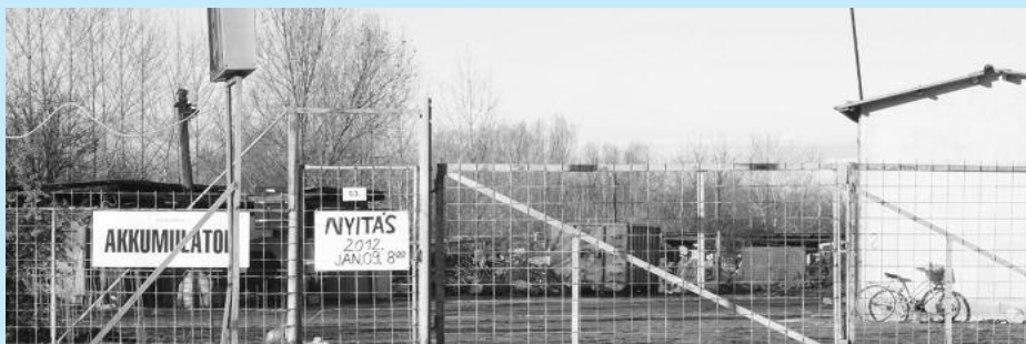
Fotó: Csilla Fotó