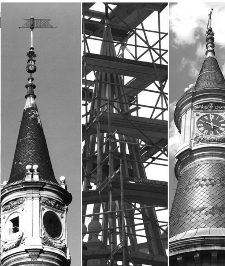
2011 júliusában elkészült az óratorony felújítása a turai kastélyban

nyitottak vagyunk minden olyan, a szállodai hasznosítástól akár részben vagy egészben eltérő irány megvizsgálására, ami egy finanszírozható projekt keretében megvalósítható.