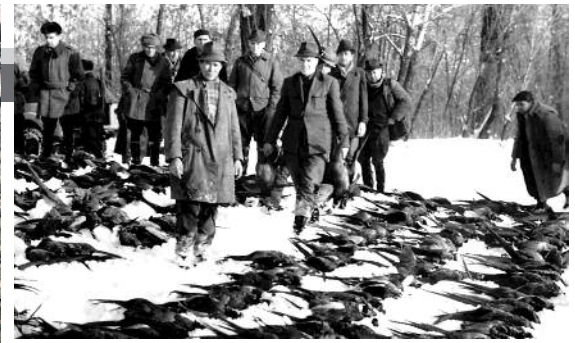
A vadór feladata: felügyelni a rábizott területet

aszódiak. Azt hitték, vissza tudnak majd szökni. A kísérők azonban megszámoztak bennünket többször is, és kiderült a hiány. Megtalálták és nagyon megverték azokat, akik elbújtak.